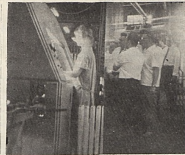
Dolgozóink egy csoportja az Izzó neoncső részlegében.

A II. világháború szinte felmérhetetlen kárt okozott a gyárnak. A fasiszták elhurcolták gépeiket, rommá váltak épületeik. Csak fokozta a nehézséget, hogy a gyárat a tőkés konkurrenciára igye-