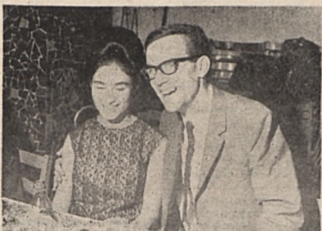
Szovjet kisleány és magyar fiú barátságát köt a vállalati KISZ—KOMSZOMOL találkozáson.