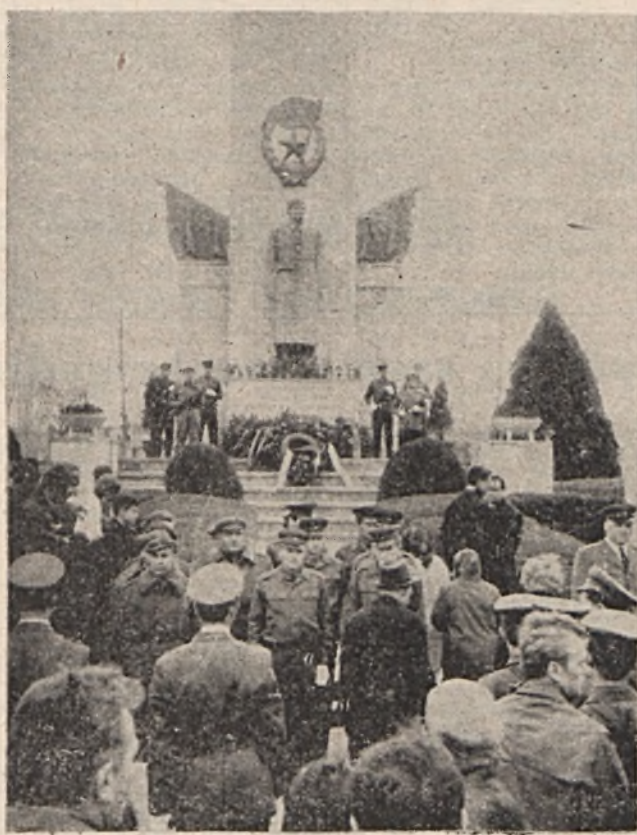
Városunk lakossága november 7-én ünnepélyes külsőségek között helyezte el a hála koszorút, virágot a pécsi köztemetőben lévő Szovjet Hősi Emlékmenél.