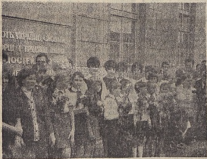
Virágcsokros úttörők üdvözölték delegációkat Csapon