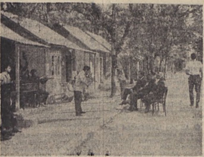
▲ hétszeres VIT-díjas rajkőzenekar köszönti a Lenin-díjas szovjet veteránokat