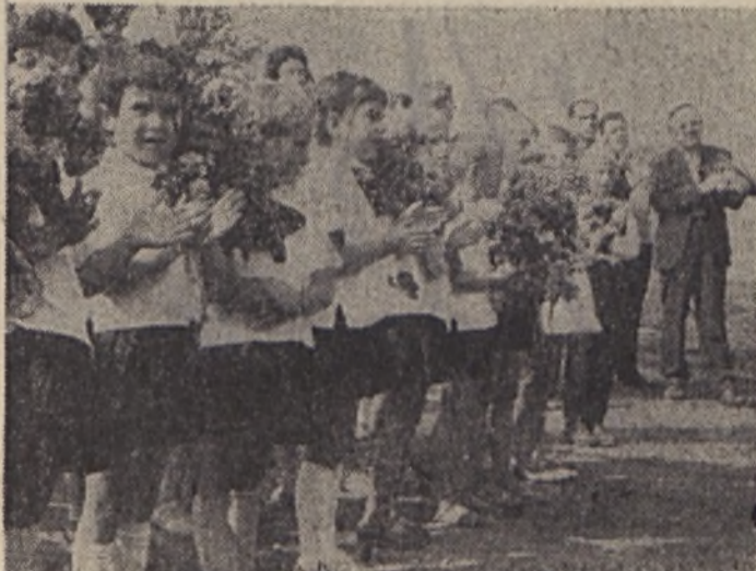
Klimbavkai úttörők köszöntik a kolhozlátogatásra érkező magyar vendégeket