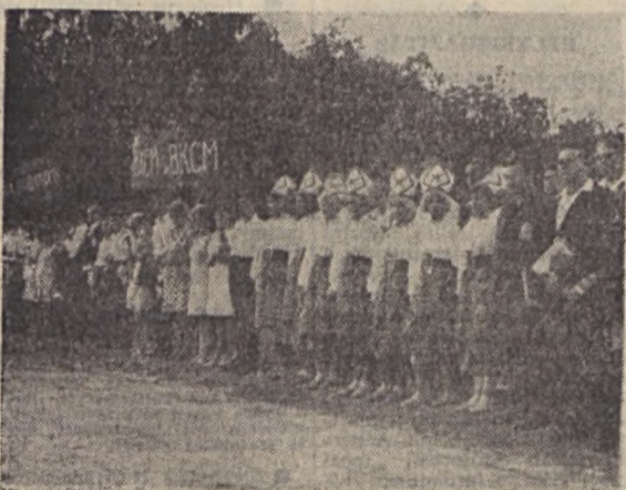
Magyar és szovjet résztvevők a tábor megnyitóján