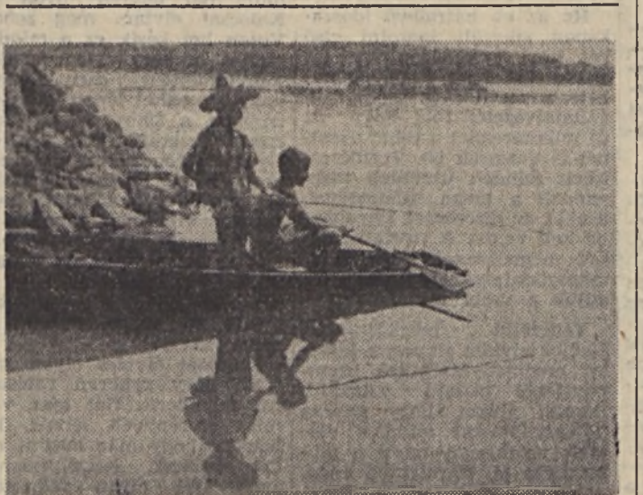
Utószezonli csendélet a mohácsi vízitelepünkön