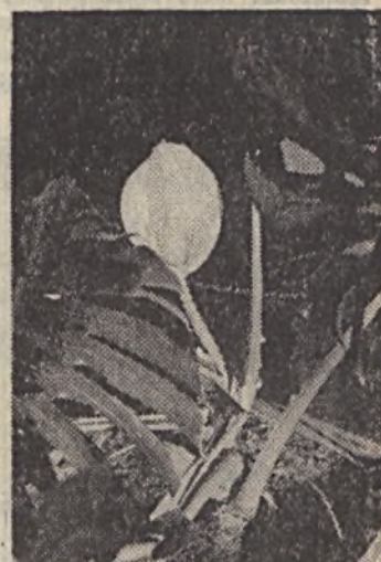
Virágot hozott a munkásszállón az egyik filodendron... Virágot hozott a munkásszállón az egyik filodendron...