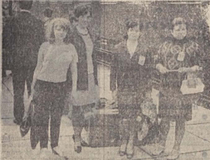
Indulás a Nyugati pályaudvarról