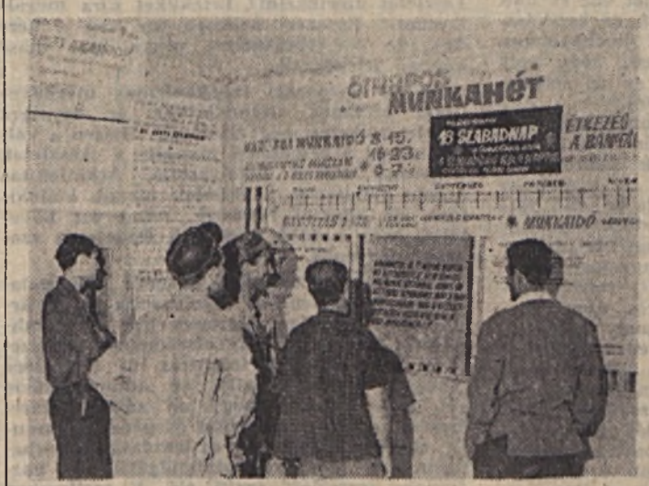
A dolgozók érdeklődéssel szemlélik az új munkarend tájékoztató plakátját.

Az Országos Bányaműszaki Felügyelőség megbízottai közölték, hogy a földalatti étkezésre vonatkozó tilalmat a kísérleti időszak alatt a III. Bányáüzemre vonatkozóan feloldják.