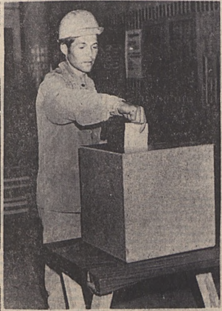
Szavaznak a dolgozók az új munkarend bevezetésére. Igennel szavazott a dolgozók 90,7%-a.

— Többször is felvetődött már: miért késik nálunk az ötnapos munkahét bevezetése? Legutóbb a Kollektív Szerződés tárgyalásánál kaptunk több ilyenirányú kérdést. Akkor az volt az álláspont, hogy a munkaidőben és az étkezéskor fennálló kötıtségek gátolják nálunk a megoldást. Azóta azonban — mint ismeretes — tárgyalásokat folytattunk annak érdekében, hogy a kötıtségek alól felmentsék vállalatunkat. A felmentést meg-