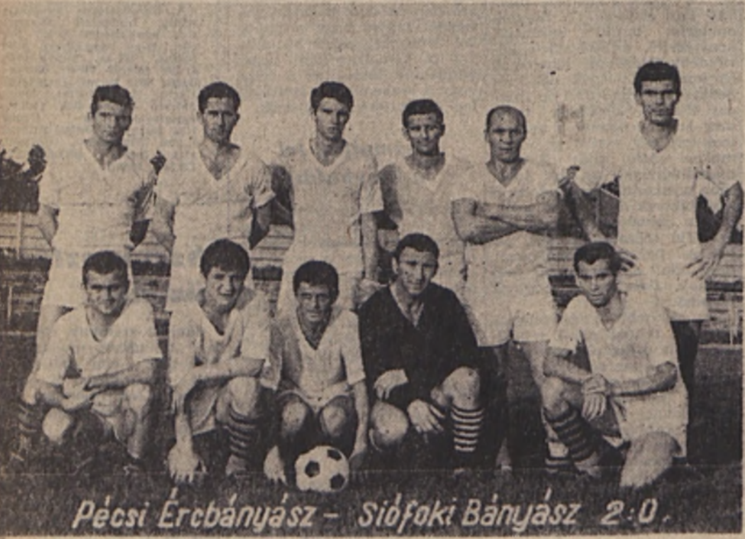
Pécsei Ercbányász - Sifokai Bányász 2:0

PÉCSI SZIKRA NYOMDA Pcs., Munkácsy Mihály u. 10. sz. F. V. J. Molles Rezső