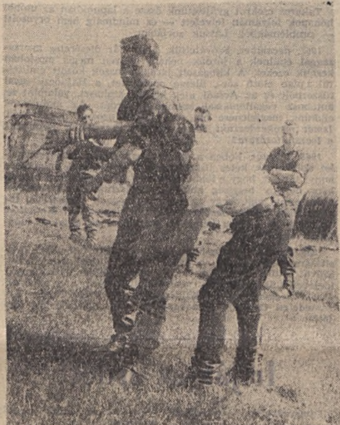
Önvédelmi kiképzés a körletben

— Gépkocsira! Hangzott a vezényszó 19-én reggel 7 órakor a „főhadiszállás” udvarán, ahol éppen jelen voltam. Szél kezdetét vette a koncentrált kiképzés. Ez a század a lőtérre indult, de ugyanakkor másik egységek is megkezdtek kiképzésüket a kijelölt helyeken, kik a körletben, kik egy erdő tisztásán. Három napig szüntelenül dolgoztak híradósaink. Az egységek és parancsnokság között rádió- és telefonösszeköttetés óramű pontossággal működött. Parancsok röppentek az éter hullámain, de pár