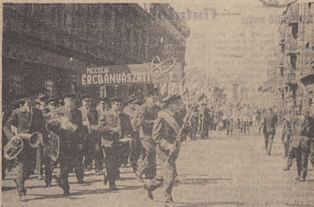
Bányászaink a Rákóczi útról felkanyarodnak a Széchenyi tér irányában.

Májusfák, léggömbök, zászlók és transzparenszek rengetegében gyülekezett a Rákóczi úton a III. sz. bányauzem szocialista szállítási körlete. Mindenkinek a kabátján ott volt a kis piros szalag és izgatott, morajló beszélgetés közepette várták azt, hogy a menet elinduljon a tribün felé, ahol üzemünk és városunk vezetői várták a felvonulókat. A szállítási körlet vezetője és a felvigyázók szívélyes, baráti légkörrel fogadták a Szénbányászati Tröszt István-aknai szállítási körletének dolgozóit, akik 9 fővel hullámzó tömegben, szinte el-