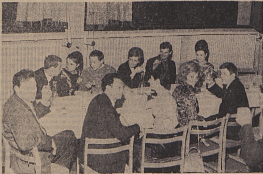
A közelmúltban a szovjet szilveszter küldöttség látogatta meg a KISZ központi alapszervezetét. Képünkön: a baráti találkozó résztvevőinek egy csoportja.