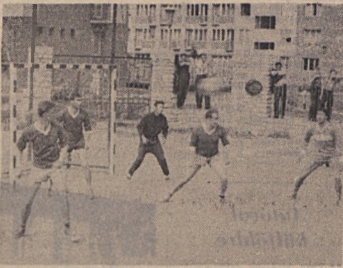
Jelenet a Bányász Kupa II. fordulójából. II. bányász-Üzem—Szolgálató Üzem 5:0.