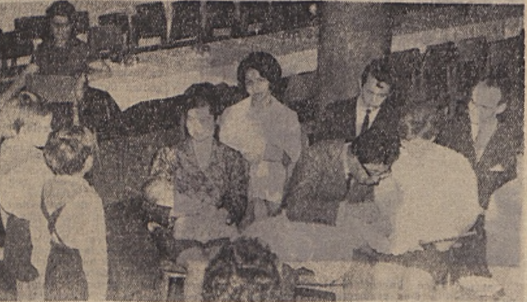
Ötös névadóünnepséget rendezett a III. hányázem KISZ-szervezete és szakszervezeti bizottsága. Képünkön az útlőrök köszöntik az újszülötteket.