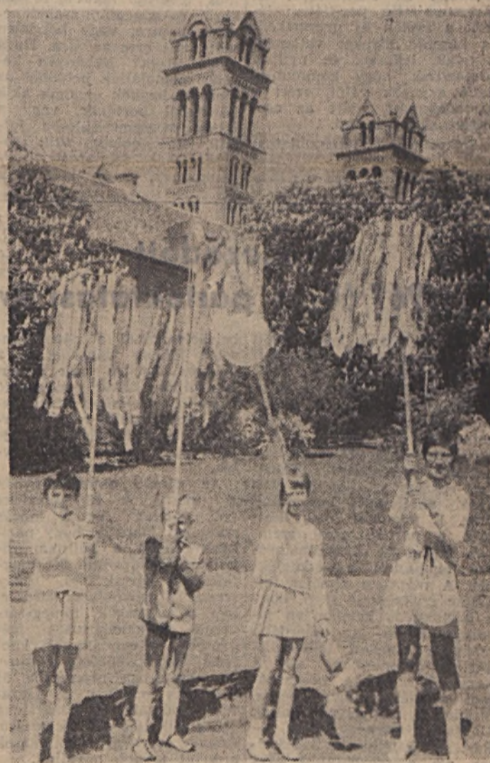
Négy kis ünneplő a Sétatéren

sem lehet hinni, hogy ez a munkásosztály évtizedekkel ezelőtt nem ünnepelhetett, mert ádáz szemek figyelték minden megmozdulását. Hála és köszönet a Szovjetunióknak, szocialista hazánknak, népünknek, mely élni tudott függetlenségével s kiharcolta a politikai és egyéni jogait is. A felvonulók a disztribúción értek és azt hiszem mindenkinek nagyon kellemes és jó érzés volt, amikor a hangsbemondón keresztül a két-