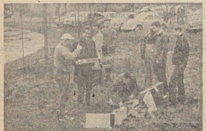
A prágai verseny után

kiváló eredmények születésnek. Azt is kevesebben tudják, hogy egy-egy versenyen a modellező 30 km-t is fut, amíg modelljét röpteti, futtatja. Talán ez a sportág még nehezebb is sok másnál, mivel egyszerre kíván a sportolótól technikai és fizikai felkészültséget. A versenyeknek előbb meg kell építenie modelljét, hogy ezután azzal versenyen elindulva eredményt érjen el.