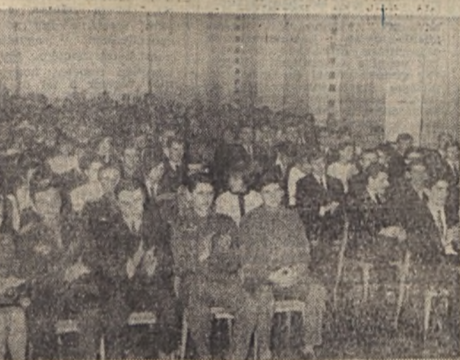
A Szovjetunóló vörös hadserege megalakulásának 50. évfordulója alkalmából vállalatunk KISZ-bizottsága szervezésében ünnepi megemlékezést tartottak február 23-án a Ságvári Endre Művelődési Házban

I. sz. bányauzem KISZ alapszervezetének tagsága