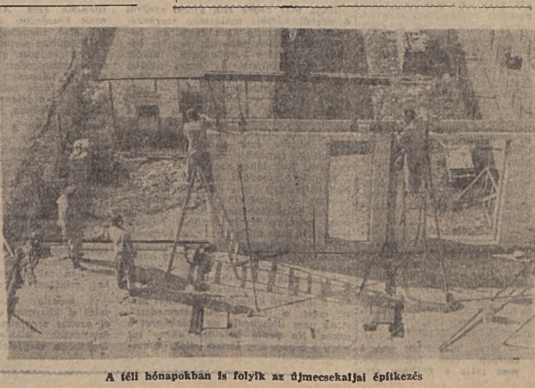
A tél hónapokban is folyik az újmecekljai építkezés