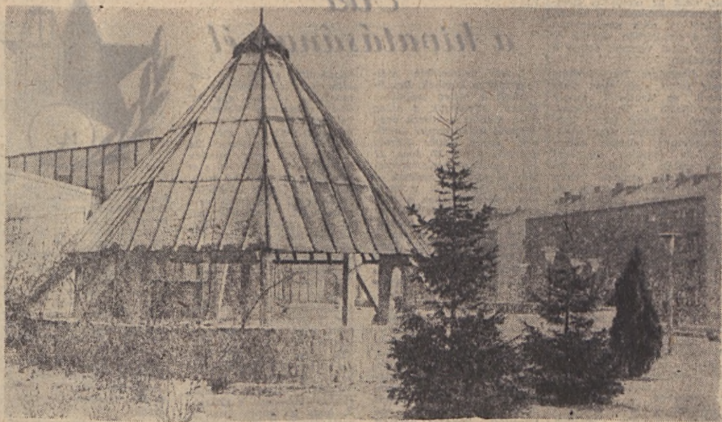
Az első havas reggel Újmezeán 1967.