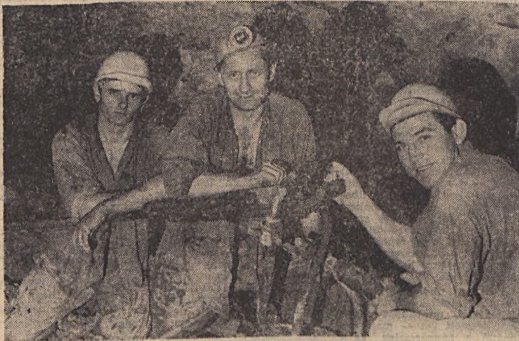
A Ságvári Endre szocialista brigád a munkahelyen.