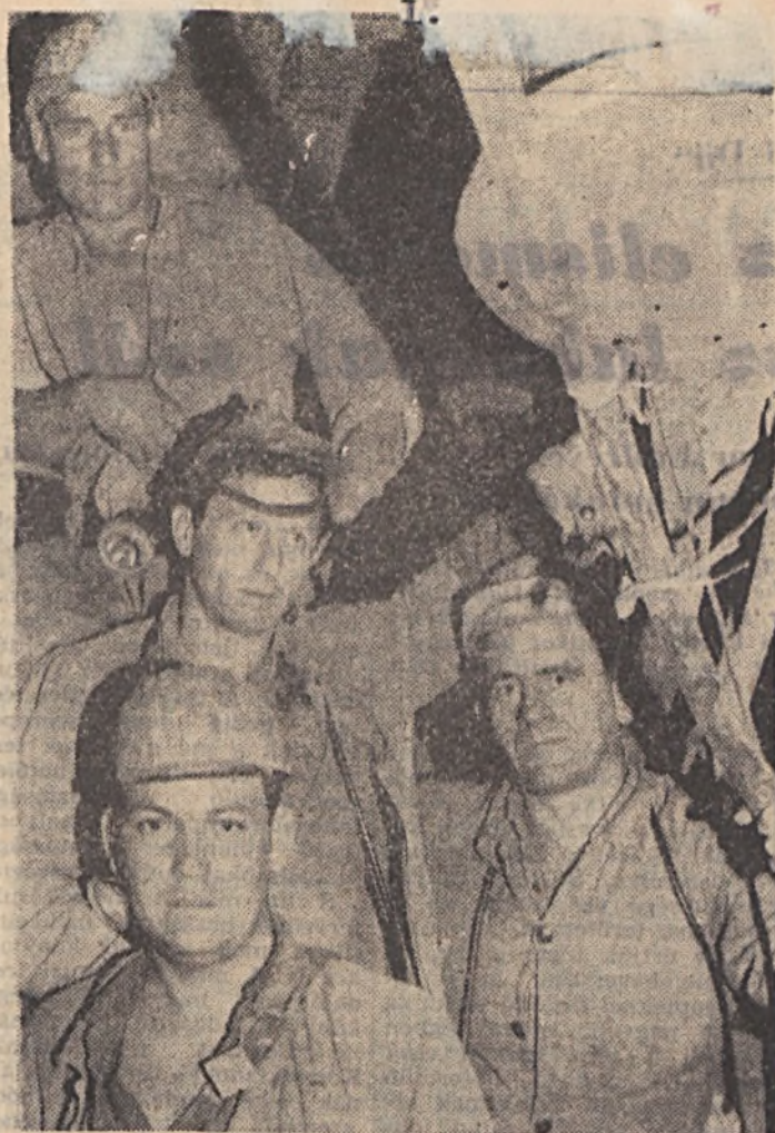
Az első félévben győztes Kalocsai-brigád jó együttműködésben a bányamérőkkel.