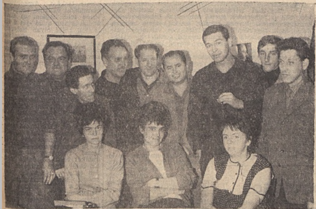
Kutató Mélyfúró Üzem dolgozóinak egy csoportja