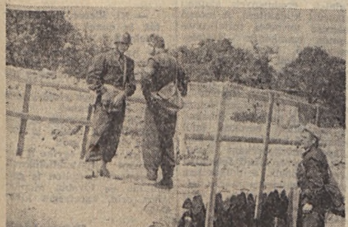
A gyakorlat jól sikerült