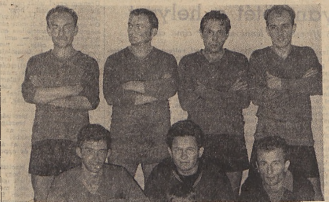
Az üzemi kispályás labdarúgó bajnokság 4. fordulójában nehéz küzdelemben az igaz- galóság csapata 5:2-re győzött a Kísérleti Kutató Üzem csapata ellen.