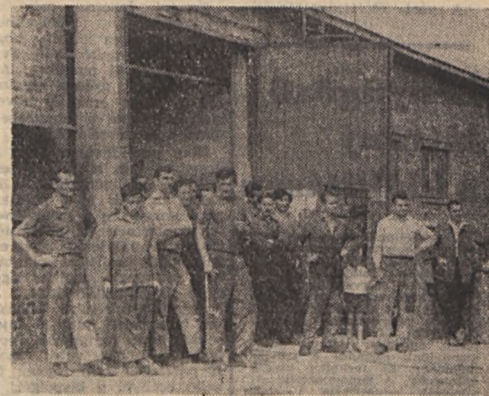
A Szolgáltatóüzem dolgozóinak egy csoportja

Az eddigi munka alapján elért eredmények és dolgozóink lelkes összhanglata arra köteleznek minden párt és tömegszervezeti vezetőt, hogy most menetközben méreletet készítsünk, megállapítsuk, hogy az eredmények mellet mit kellene és lehetne jobban, eredményesebben végezni. Mert lehet és kell is jobban dolgozni. Nem számít ünneprontásnak és az eredményeink értékét sem csök-