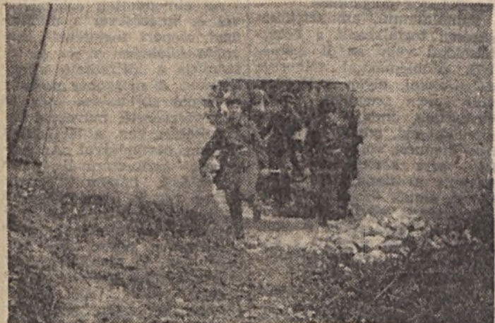
Szállítják a „sérülteket”