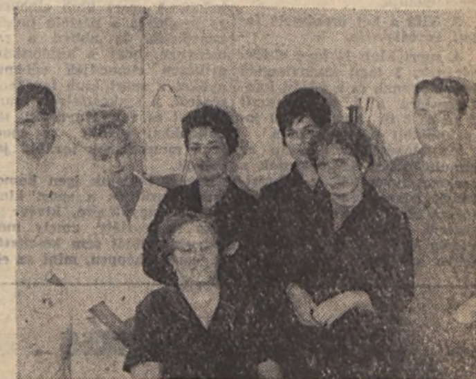
Az EDÜ Vegyi-labor dolgozói

Meg kell vizsgálniuk újra annak lehetőségét, hogy hogyan lehetne szocialista brigádba szervezni a szárító és a laboratórium váltóműszakos dolgozóit. Elképzelésük, hogy a jövő évi brigádszerződések színvonalának emelése céljából a gazdasági és társadalmi szervekkel karöltve, üzemszervezetre lebontott vállalási pontokat állítanak össze, melyekből a brigádok válogathatnak majd. Ezek olyan