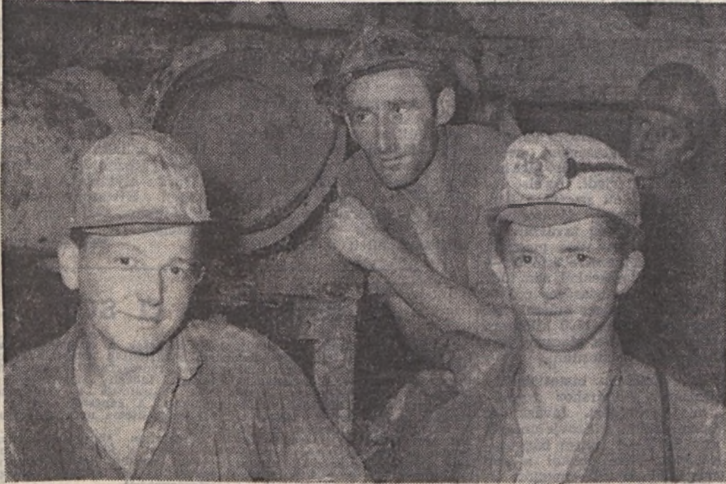
III. Bányász, 17-es fejtési szocialista brigád 129,6 százalékra teljesítette féléves tervét