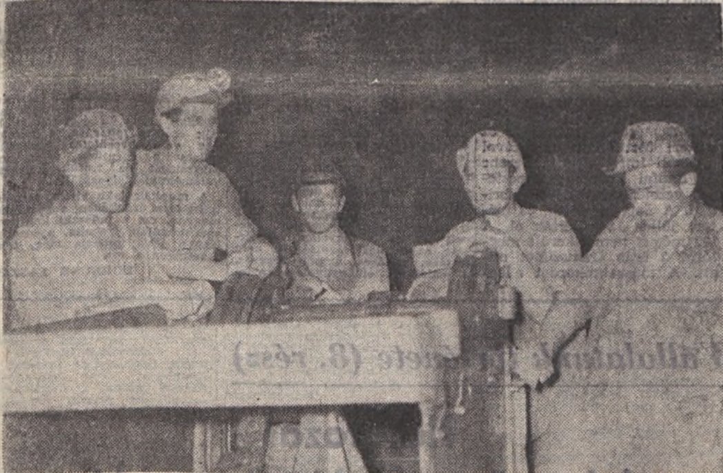
A 45-ös vágathajtó szocialista brigád júniusban 125 százalékot ért el.

Vállalatunk a fontosabb tervmutatóit a II. negyedévben is teljesítette. Az I. félév eredményei értékelése közben már most elmondható, hogy az I. féléves fontosabb mutatóink a tervnek megfelelően alakultak, sőt kisebb mértékű túlteljesítés is jelentkezett.