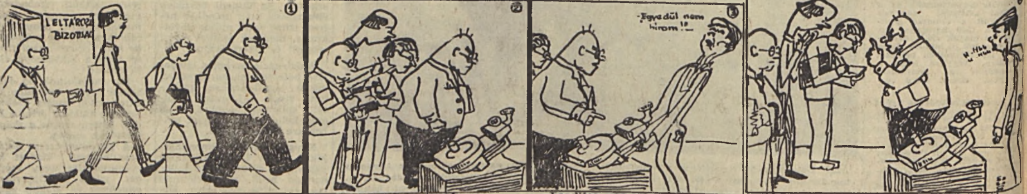
„M lehet o leltári szomo? Meg kellene fordítani!”

eltári fejtörő /-vagy, mikor a kényelem legyőzi a lelkiismeretet./