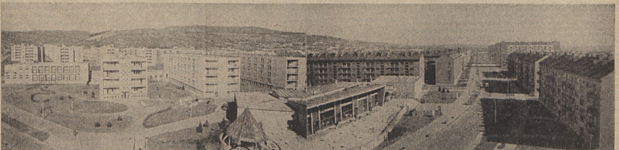
Újmecsekalja, 1967. május 1.