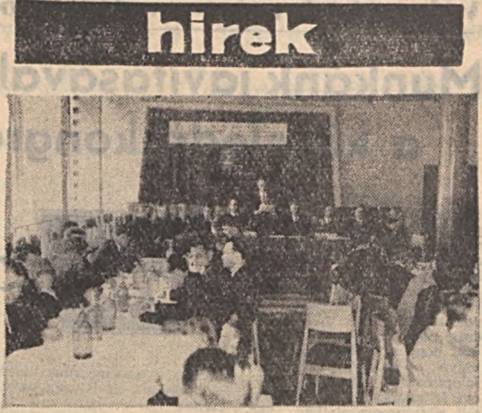
Megválasztották a szakszervezeti tanácsot az I. bányauzem szervezett dolgozói