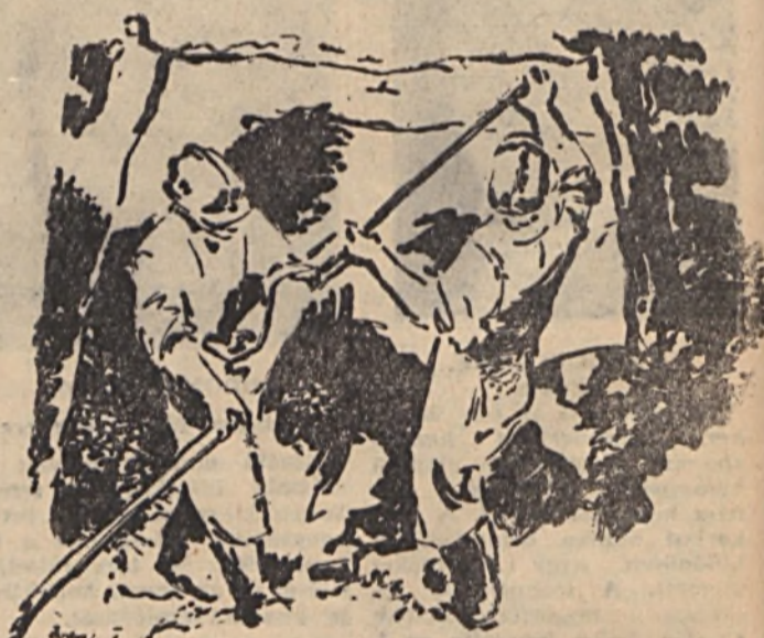
BODROGI FRIGYES: A bányászok

Márciusban volt négy éve, hogy a Ságvári Endre Művelödési Házban az Ércbányászati Vállalat dolgozóinak egy kis csoportja kérsére megalakult a képzömművészkör. A vállalat példamutató anyagi támogatásával egy év alatt sikerült a munka anyagi feltételeit biztosítani és ennek folytataként a képzés sokrétűségét és a szintjét is folyamatosan emelni. A körnek célja ugyanis elsödolegesen népművelés és csak másodlagosan előkészítés egyetem és főiskolákra való felvitelére. A fő cél az, hogy elméletileg és gyakorlatilag közelebb jussanak a kör tagjai a képzömművészeti alkotásukhoz. Necessz foglalkozások legyenek a műalkotások értékelés feltételeiben, de aktívan közvetítsék is környezetükben a képzömművészeti alkotások megértéséhez szükséges ismereteket. Ezért is szorgalmazzuk az évben a vettettképes előadásokat, s a foglalkozásokon színes filmanyagot keresztül az alkotások elvezetésére és könyvtárunk gyarapításával a könyvek olvasását. Érté ragadunk meg minden ajánlás lehetőségét arra, hogy minél több képképzést nézzünk meg rajtuk és, hogy ezek anyagát kritikus szemmel nézzék, bírálják.