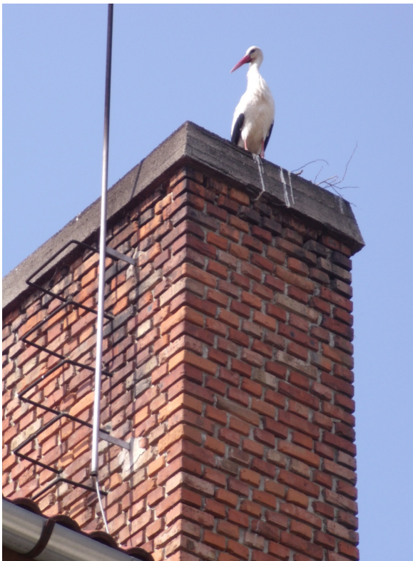
Gólya költözött az Önkormányzat épületének kéményére.