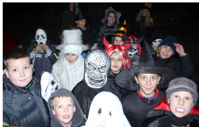
Halloween – már Keszüben is!