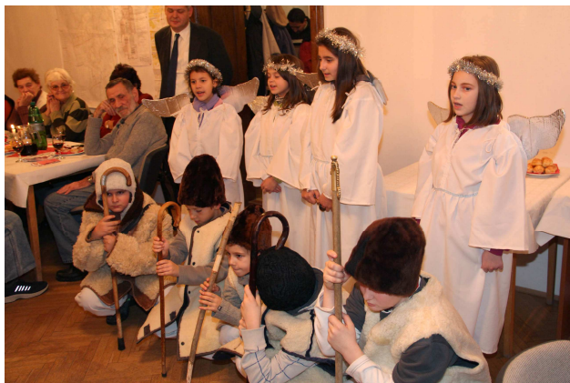
A betlehemes előadás nagy sikert aratott