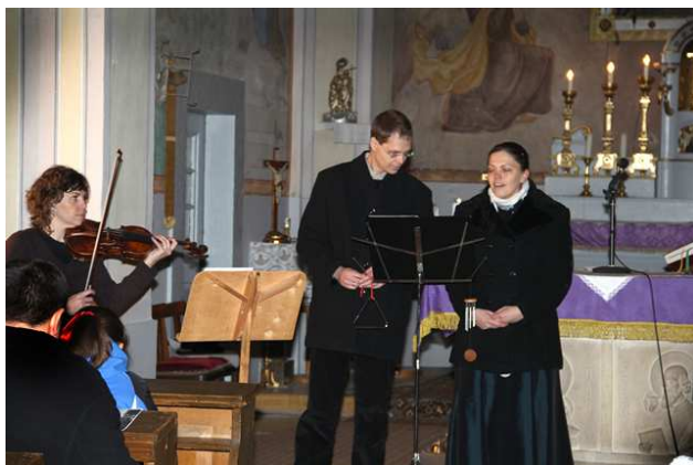
A hagyományos adventi koncerten keszűi művészek és gyerekek léptek fel