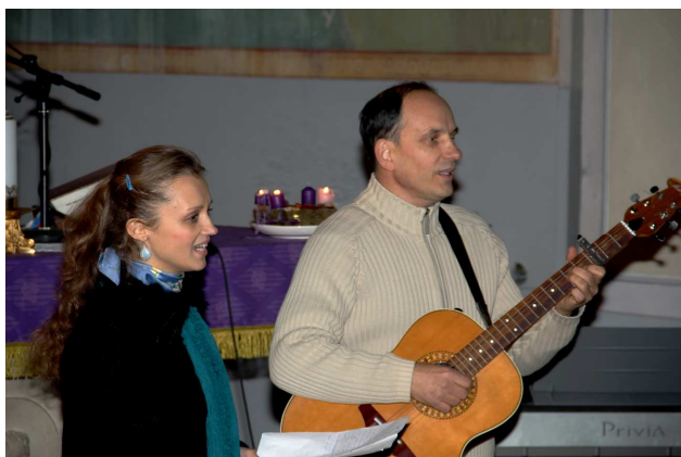
December 29-én borszentelő volt a keszűi templomban