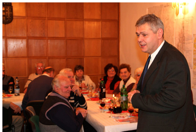
A nyugdíjasok karácsonyi ünnepségén polgármesterünk köszöntette a résztvevőket