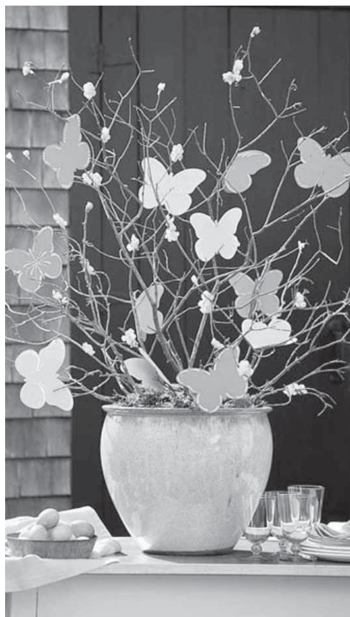
Bárhová is tegyük a lakásban, mindenképp azt sugallja, hogy megérkezett a tavasz! Akasszunk néhány pillangót az ágakra, melyet színes papírból vágjunk ki, majd fehér filccel rajzoljuk meg a pillangó körvonalát.