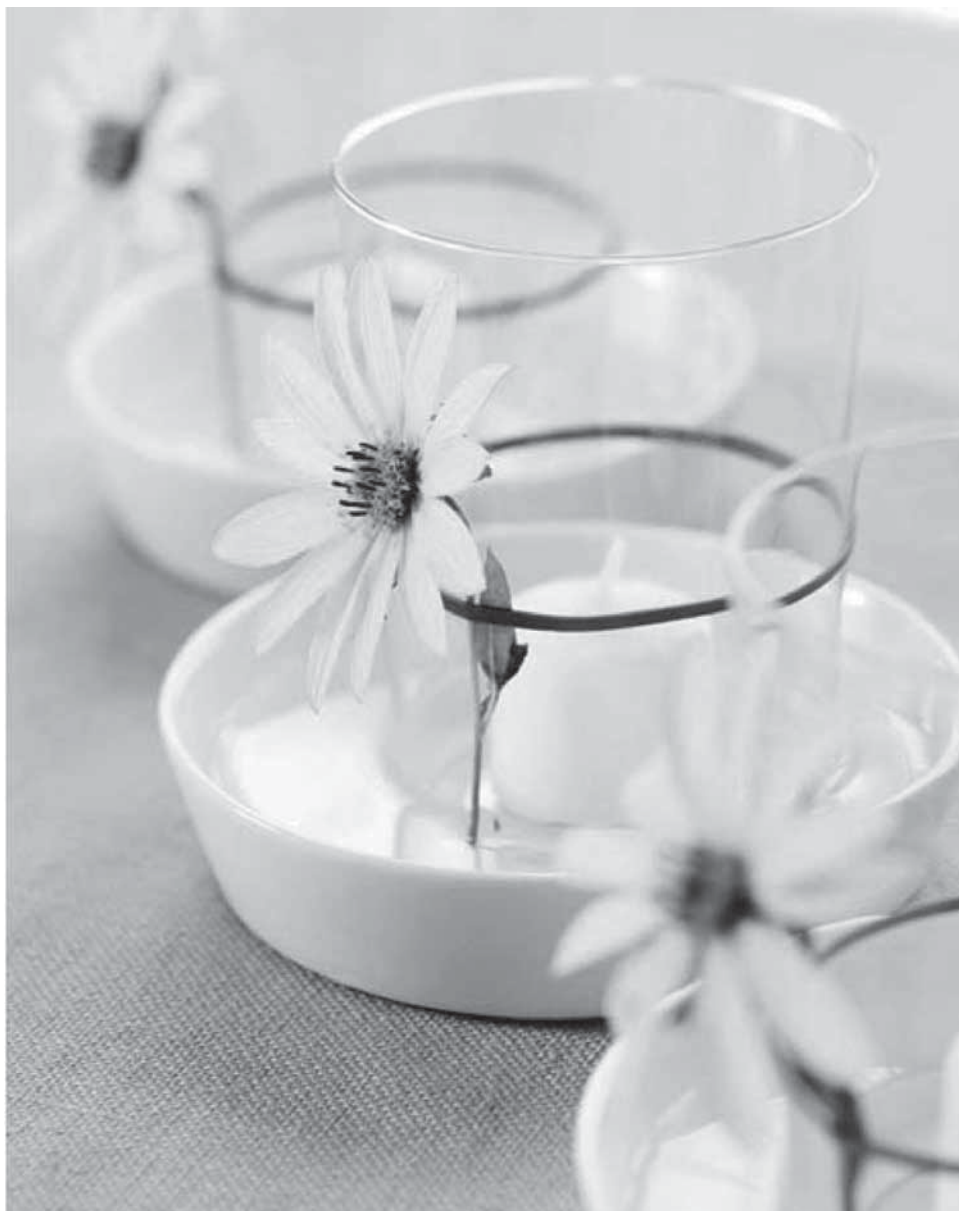
Pillanatok alatt az asztalra varázsolható, csupán pohár, gyertya, befőttes gumi és virág szükséges hozzá.