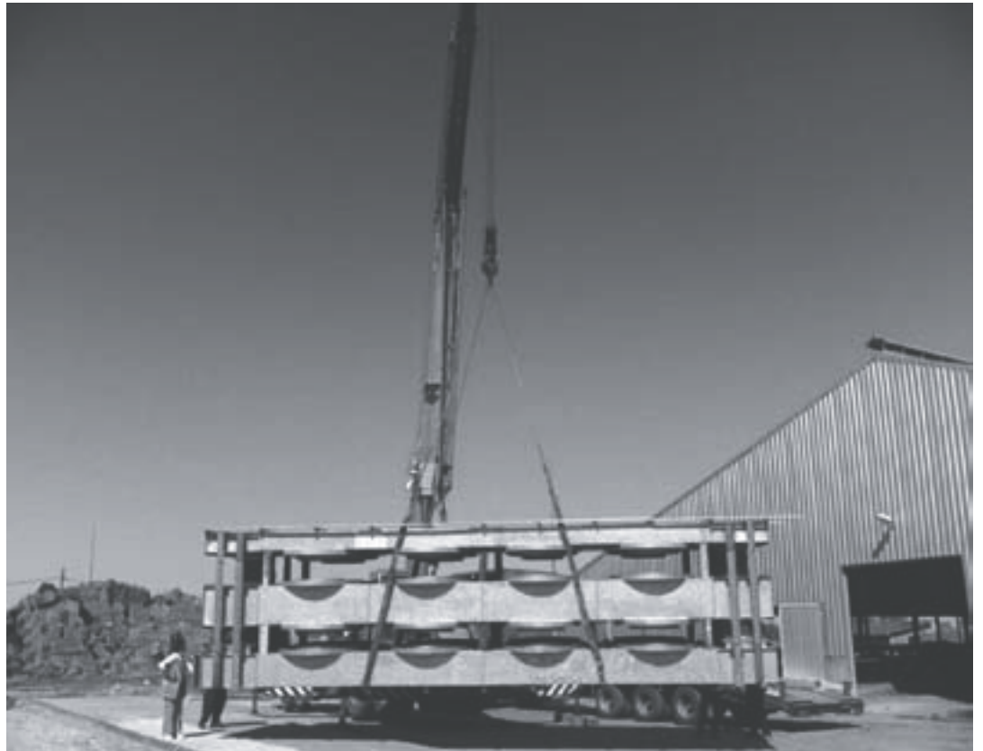
Új szénaszárító telepítése, háttérben az új 302 férőhelyes istállóval.

A cégcsoport másik állattenyésztéssel foglalkozó tagja a BoBi-Ser Kft., mely egy 350 kocás telepet működtet. Aktívan részt vesz a pályázati lehetőségek kihasználásában, az elmúlt három évben fontos rekonstrukciós beruházást hajtottak végre. Az AVOP pályázaton elnyert támogatást egy új, modern technológiával felszerelt fűtő és malac utónevelő kialakítására fordították. A termekben elhelyezett hőmérséklet szabályozók segítségével évszaktól függetlenül megfelelő klíma és környezet alakítható ki az állatok számára. A beruházás tervezésénél messzemenően figyelembe vették a környezetvédelmi szempontokat, az egyes termek alatt lagúna rendszer alakítottak ki, amelybe a hígtrágya folyamatos összegyűjtése történik, majd az innen egy zárt csőrendszeren keresztül kerül a tárolómedencébe. A szintén új kialakítású tárolómedence szivárgásjelző rendszerrel felszerelt és búzázó réteggel fedett, 3 500 m 3 -es nagyságú. A technológia lehetővé teszi a szaghatás minimali-