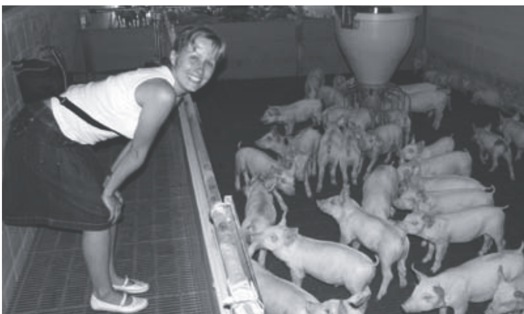
Az új malac utónevelő termék egy lelkes látogatóval