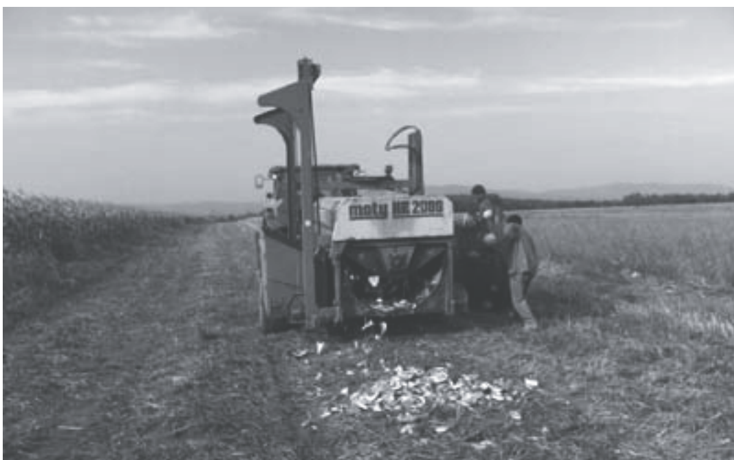
Olajtök betakarítása a Bicsérdi-Bio Kft.-ben.

• a jóindulatú prosztatata megnagyobbodás tüneteinek csökkentésére, illetve megelőzésére • koleszterin szint csökkentésére, szívinfarktus kialakulásának megelőzésére • agyi keringés normális állapotának fenntartására.”