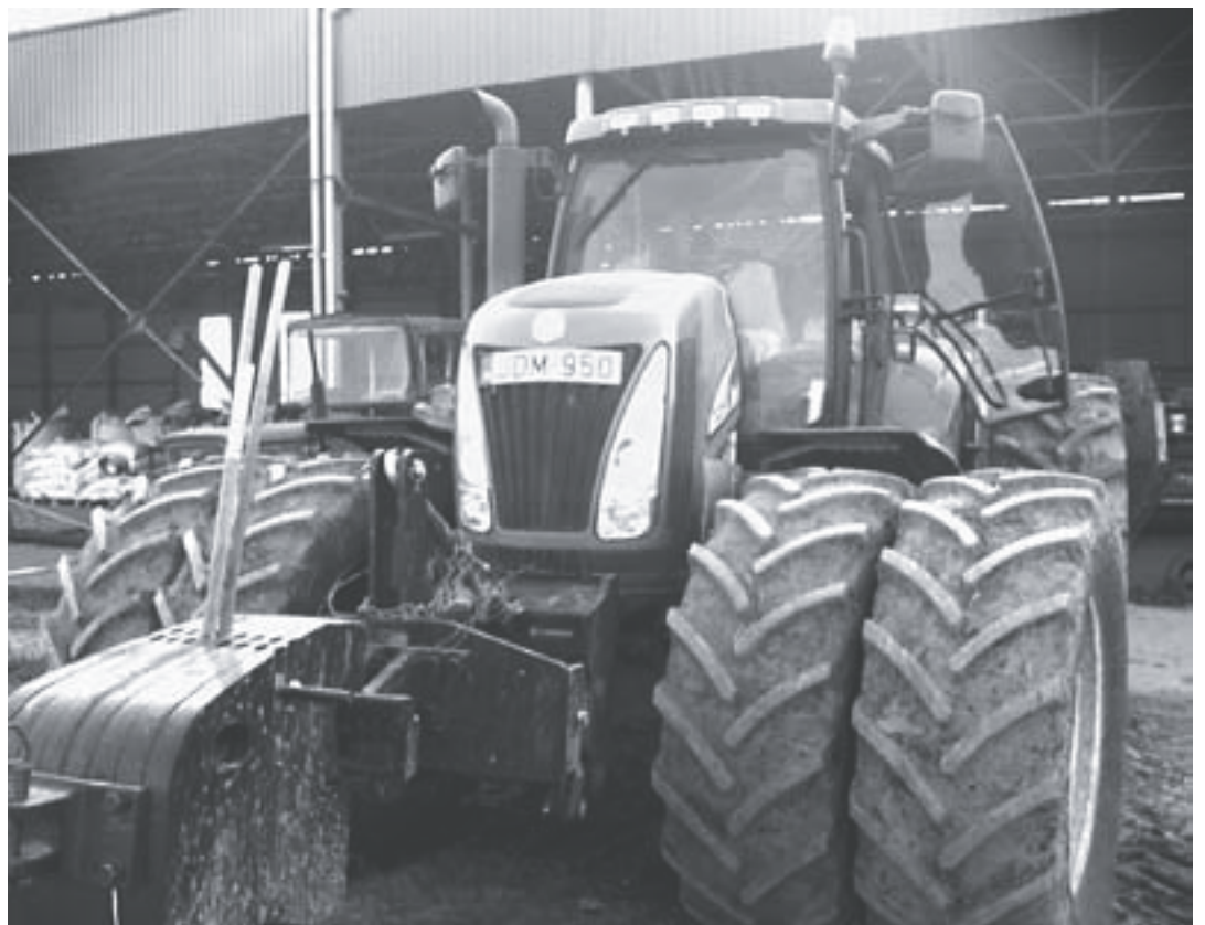
Nagyteljesítményű traktor a növénytermesztés szolgálatában.

A B-Aranykorona Kft. a cégcsoport növénytermesztésért felelős tagja. 1400 ha-nyi bérelt földterületen gazdálkodik, emellett integrátori feladatokat lát el közel 500 ha-on. A Kft. feladata a tulajdonos részvénytársaság állatállományának jó minőségű takarmánnyal történő ellátása, és a szintén részvénytársasági tulajdonú és üzemeltetésű takarmánykeverő alapanyag-szükségletének biztosítása. A hagyományokon alapuló vetésszerkezetben közel egyenlő részt képviselnek a kalászosok, a pillangósok és a kukorica, emellett ipari növényként közel 400 ha-on cukorrépat termeszt. A társaság részt vesz a Bicsérdi-Bio Kft-vel együtt