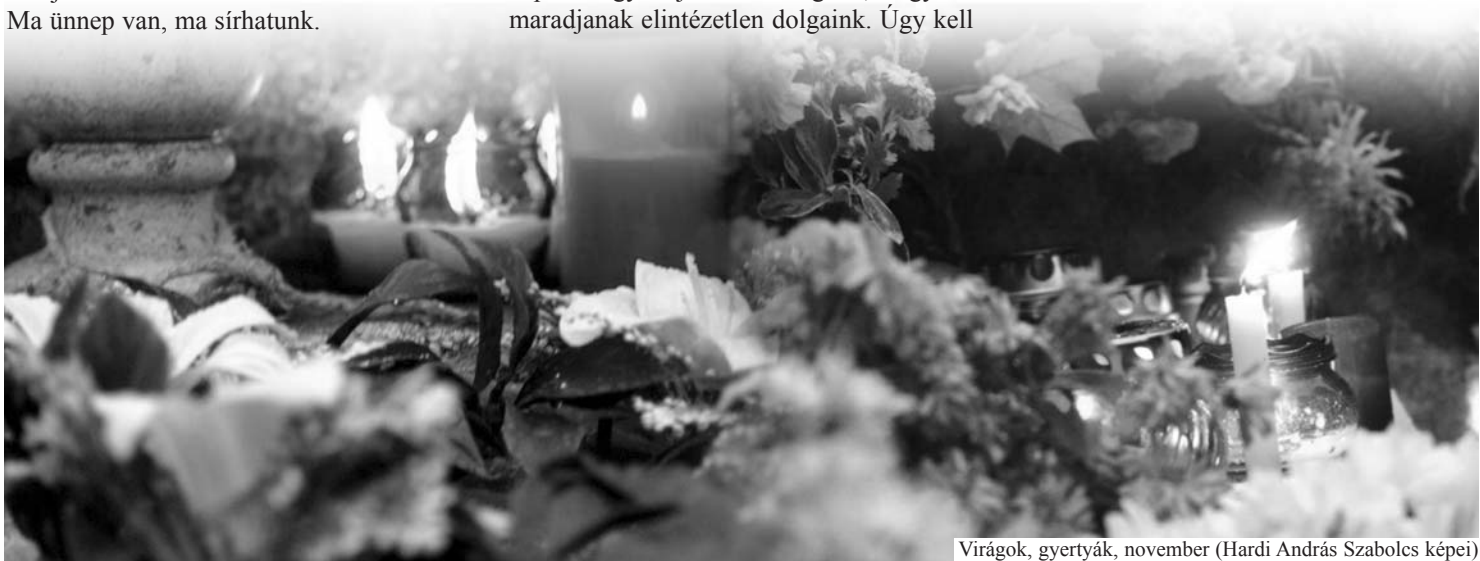
Virágok, gyertyák, november