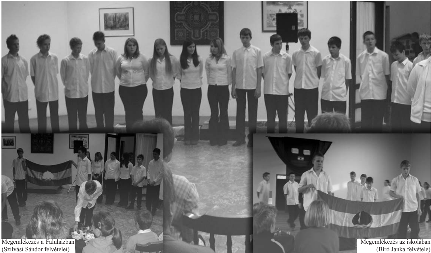
Megemlékezés a Faluházban