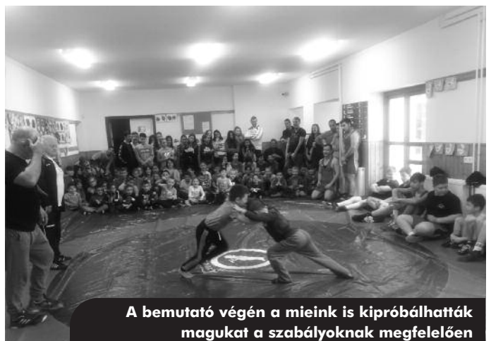
A bemutató végén a mieink is kipróbálhatták magukat a szabályoknak megfelelően