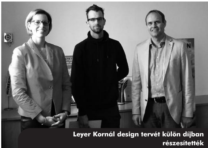
Leyer Kornál design tervét külön díjban részesítették