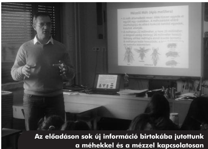
Az előadáson sok új információ birtokába jutottunk a méhekkel és a mézzel kapcsolatosan