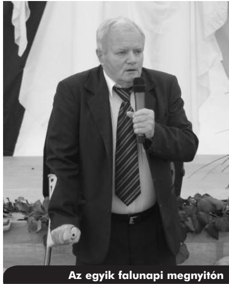
Az egyik falunapi megnyitón

Fáradhatatlanul dolgozott azon, hogy megerősítse a község lakóiban az együvé tartozás érzését, ennek érdekében helyi közösségeket hozott létre, azok fennmara-