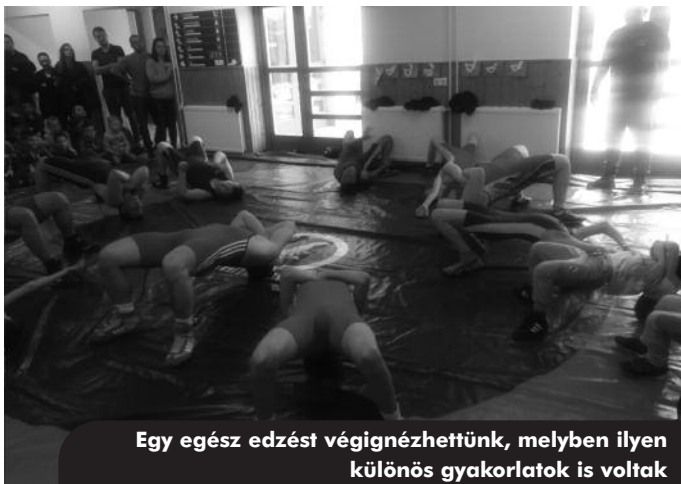
Egy egész edzést végignézhettünk, melyben ilyen különös gyakorlatok is voltak