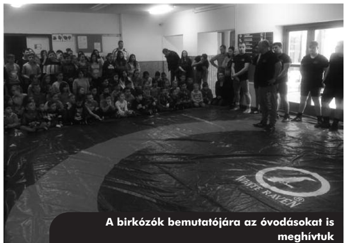
A birkózók bemutatójára az óvodásokat is meghívtuk