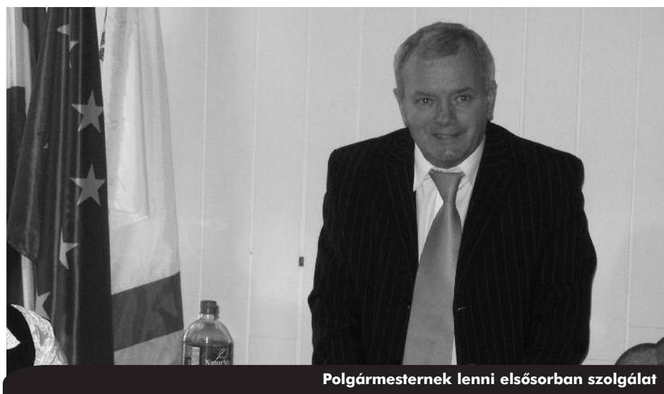
Polgármesternek lenni elsősorban szolgálat

hangon, büszkén mondja végig a polgármesteri eskü szavait: