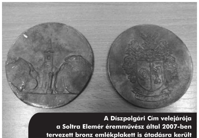
A Díszpolgári Cím velejárója a Soltra Elemér éremművész által 2007-ben tervezett bronz emléklakett is átadásra került