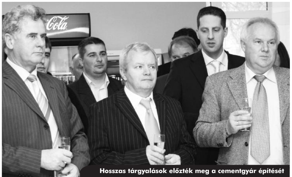
Hosszas tárgyalások előzték meg a cementgyár építését