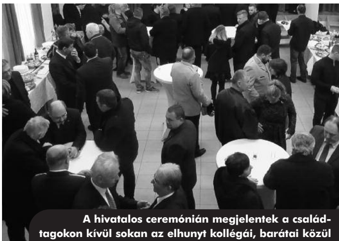
A hivatalos ceremónián megjelentek a családtagokon kívül sokan az elhunyt kollégái, barátai közül