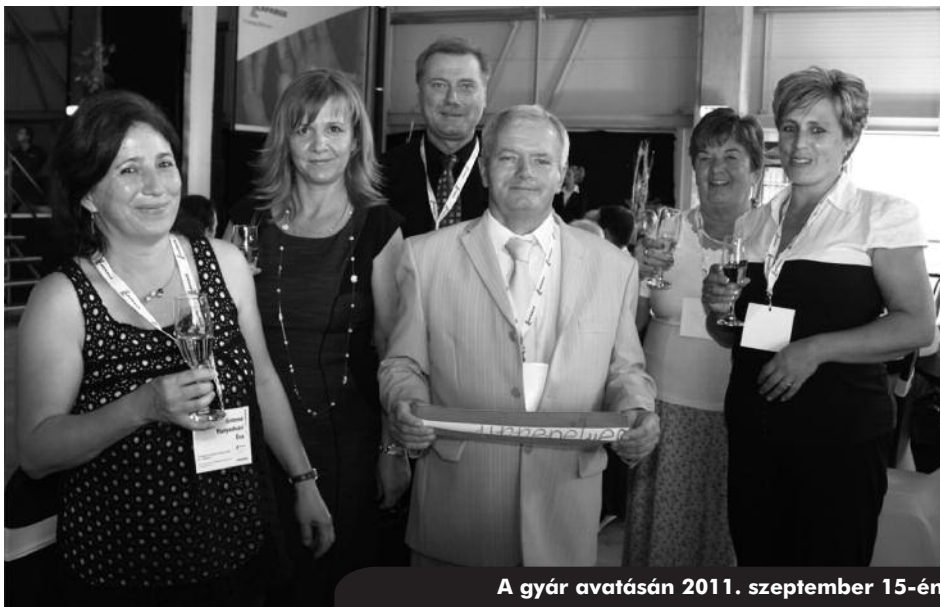
A gyár avatásán 2011. szeptember 15-én

dásáért, fejlődéséért mindent megtett. Ezirányú tevékenységének köszönhetően működik ma községünkben a Királyegyháza Felvirágoztatásáért Közalapítvány, a Nyugdíjas Klub, a Királyi Lovas Klub, a Polgárőrség, a Mozdulj Magadért Egyesület, a királyegyházai Sportegyesület, a női kézilabdacsapat. Kiemelten támogatta a Királyegyházai Iskolát és az Óvodát, mindennél fontosabb volt számára az, hogy a község gyermekei a legkiválóbb ellátásban részesülhessenek.