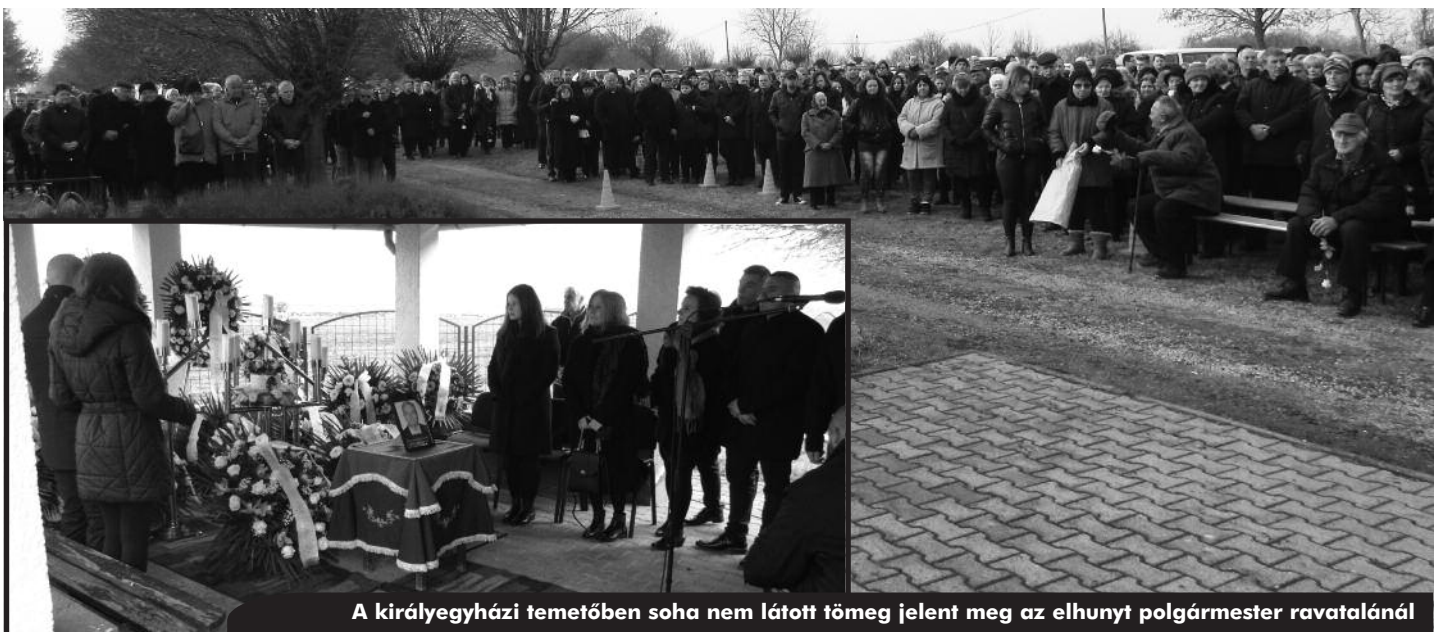
A királyegyházi temetőben soha nem látott tömeg jelent meg az elhunyt polgármester ravatalánál