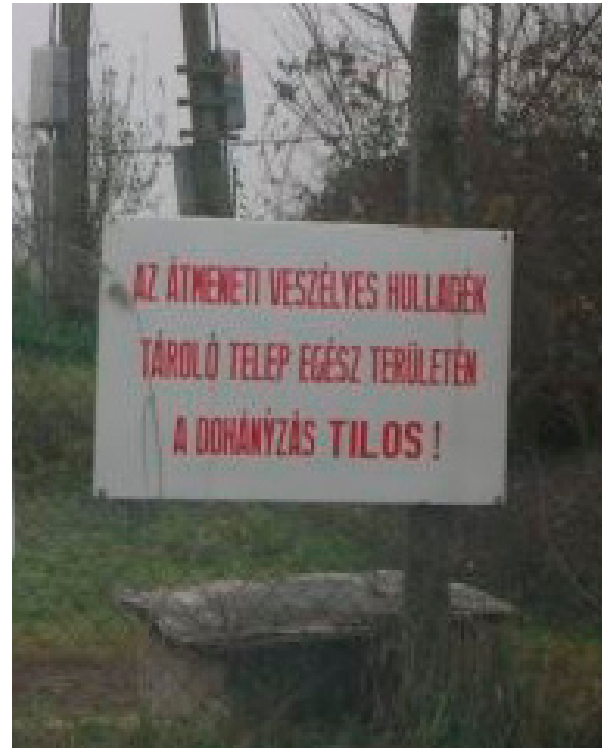
A fotó tanulsága szerint az 1977 óta működő átmeneti (!) telep területén tilos a dohányzás. Pedig itt igazán nem a füstölgés a legjelentősebb környezeti kár...

Nyomába jutottunk egy, a nyilvánosság számára eddig nem ismert ténynek: a cég a felszámolási eljárás miatt nem hívhatja le Illatos úti telephelyének kármentesítésére nyert összesen 1,6 milliárd forintos uniós és hazai támogatást sem. A helyzet tehát súlyosabb, mint akár egy hónappal ezelőtt is gondoltuk. Az Illatos úti telep ugyanis kármentesítés nélkül jóval kevesebbet ér. Hogy a tavaly előtt még kétszáz dolgozót foglalkoztató, és négy milliárd forint árbevételt elérő rt. vagyona mekkora, arra a kérdésre a Zrt. lapunk által megkérdezett jogásza, dr. Blatnyák Nándor sem tudta még a választ. A garéi kármentesítés költségére vonatkozóan is csak becsült adatok állnak rendelkezésre. Ezek szerint várhatóan további három-négy milliárd forintot emészt majd a teljes rekultiváció. Mint legutóbbi számunkban már beszámoltunk róla, ha nem elég a cég