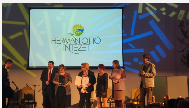
A MEZŐ vezetőségi tagjai a díjátadón