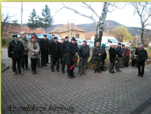
Az emlékező közösség

A meghívott vendégek az ünnepség után egy kötetlen hangulatú fogadáson láttuk vendégül a megjelenteket.