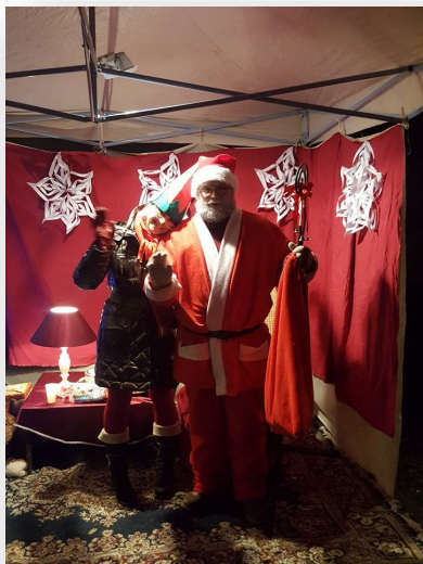
A Mikulás és MiniManó