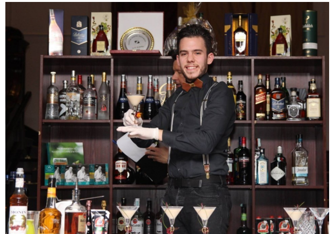
A Magyar Bajnokság döntőjében