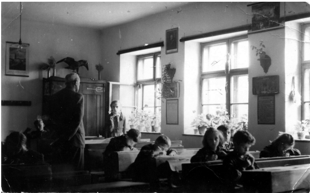
A cserkúti iskola osztályterme

Ahogy élete vége felé egyre gyakrabban visszatért gondolatban szülőfalujába, úgy foglalkoztatta egyre többet az öregkor is.