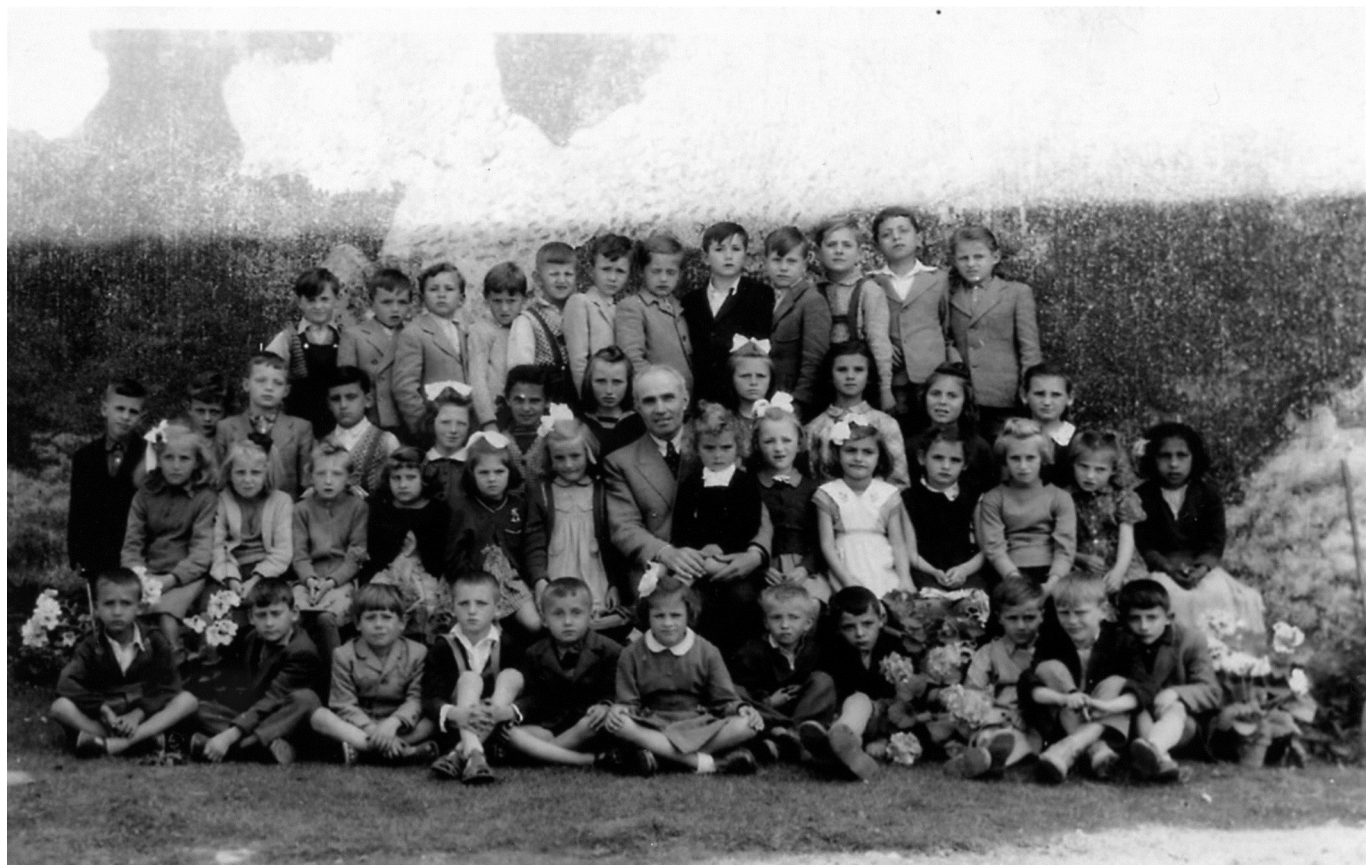
Kővágószőlősi kisiskolások ...