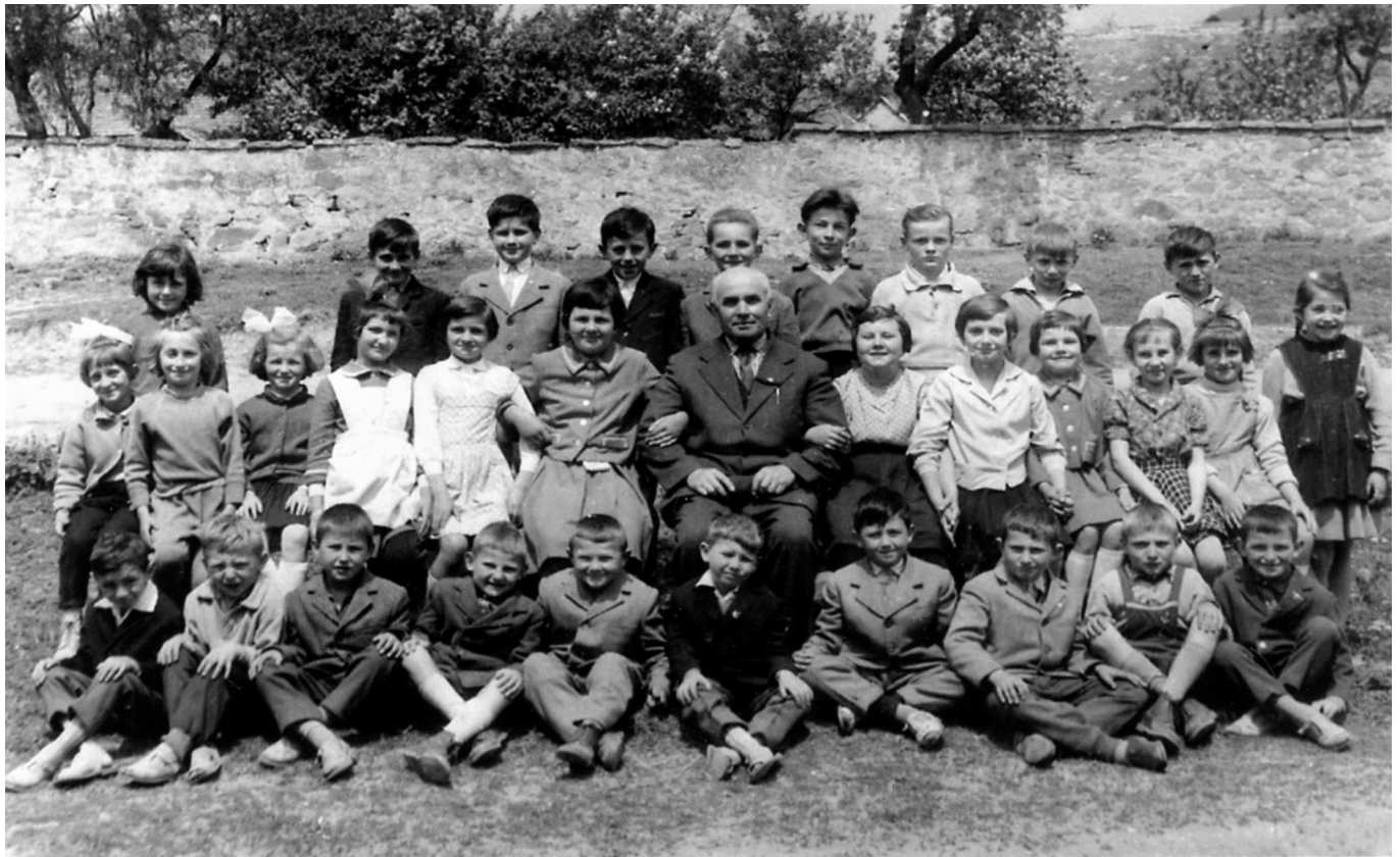
Kerti tanító úr a cserkúti kisiskolásokkal ...