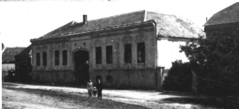
A cserkúti iskola