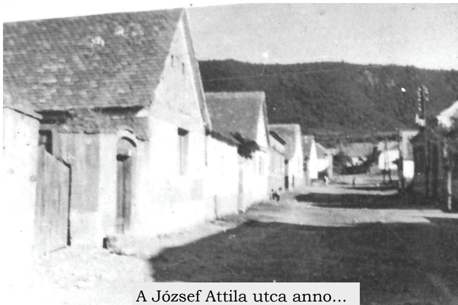
A József Attila utca anno...

Kővágószőlősön minden vasárnap reggel 8.00 órakor szentmise.