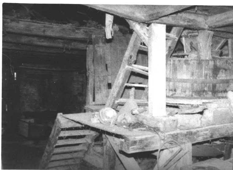
Kukoricamalom az egykori Kulin-portán