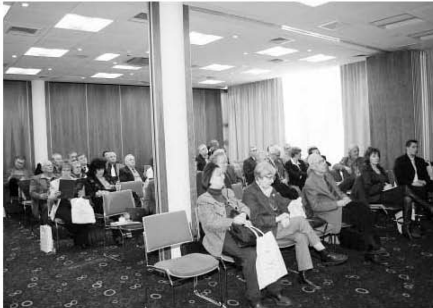
A sajtótájékoztató résztvevői

A 2008-as év legfontosabb elvégzendő feladatai közé tartozik majd az NRHT projekt keretei között az engedélyezési eljárás befejezése, (létesítési, üzemeltetési engedélyek megszerzése) a tároló infrastruktúrájának kiépítése, valamint az üzemeltetés beindítása.