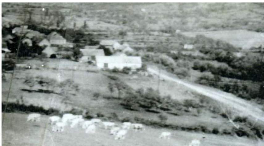
Legeltetés a Canán