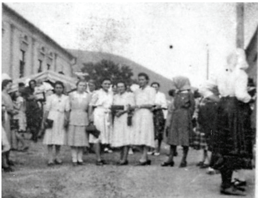
A helytörténeti kiállítás anyagából

Van ennek a háznak Olyan virágszála, Kinek harmat rózsavíztől Kivirul orcája.