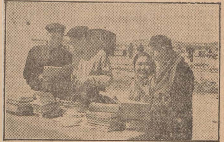
A képen: Pihenő a komszomolista ifjúsági brigád mezei szállásán, az „Ulan-Cselutaj” szovhozban (Burjat-Mongol ASZSZK)

A Szovjetunió különböző vidékeiről a szüzföldekre érkezett több ezer gépkészítő állandóan érzi a Komszomol és a szakszervezetek gondoskodását. 538 traktoros-brigád kapott rádióköszüléket, gramofont, harmonikát s különböző asztali játékokat. A kohászok, a textilmunkások, a bányászok és a vasutasok szakszervezetei több, mint 60 ezer könyvet küldtek a szüzföldeken szervezeti új géppállomások és szovhozok dolgozóinak számára. Sokat tesznek a szüzföldekre települt dolgozók kulturális ellátása érdekében Kazahsztánban a falusi klubok és olvasóházak kollektívái. Eddig több, mint 600 vándorkönyvtárat küldtek a mezei szállásokra. Agitációs brigádok és vándormozik gyakran érkeznek a különböző brigádokhoz. A falvak kultúrscsoportjai műsoros estéket rendeznek a szüzföldek megművelésén fáradozó dolgozóknak.