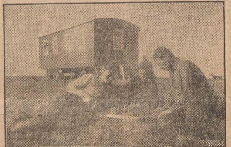
A csalovi területen nyolc új szovhoz alakul. Az ifjú gépkészítők kiváló munkát végeznek az új földek meghódításánál. — A képen: Az „Irkli-szkij” szovhoz 1-es számú brigádjának gépkészítői sakkoznak munka után