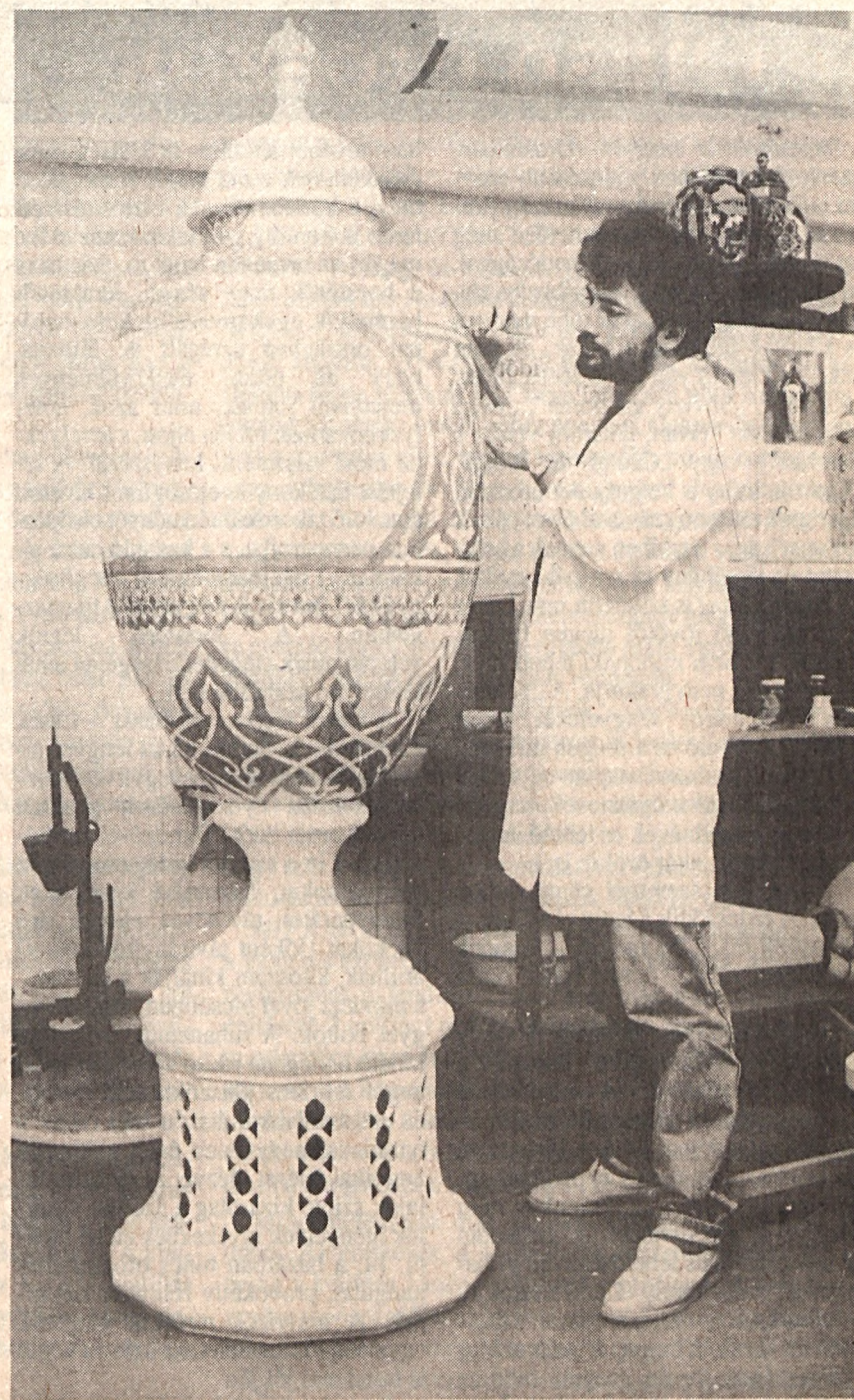
„Öltöztetik” az óriásvázát