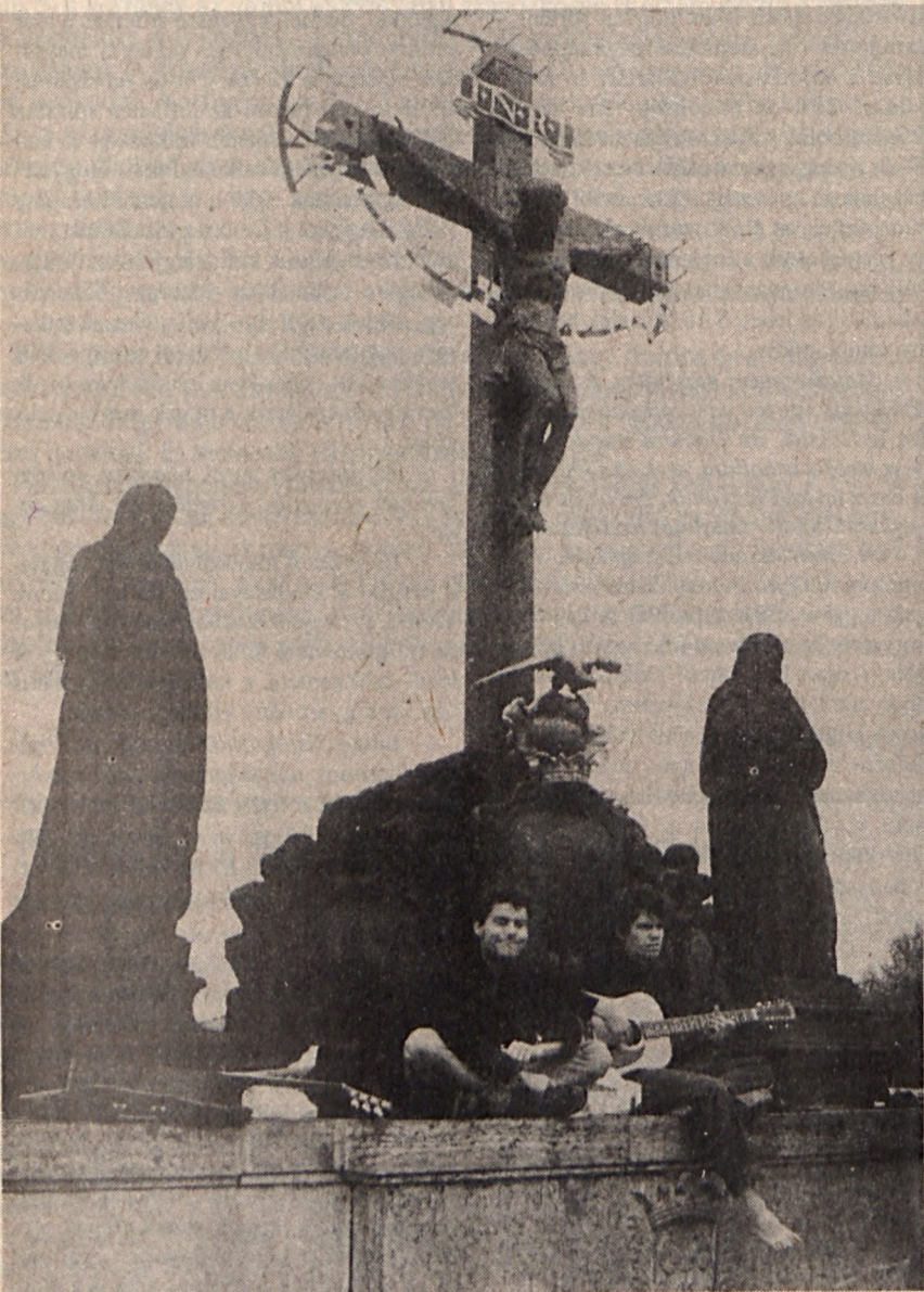
Prágai fiatalok, vagy fiatalok Prágában.