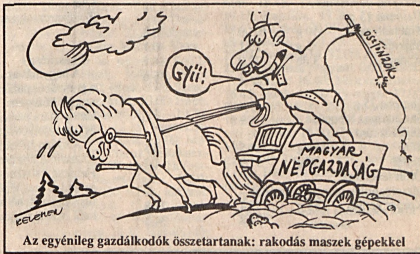
Az egyéni gazdálkodók összetartanak: rakodás maszek gépekkel