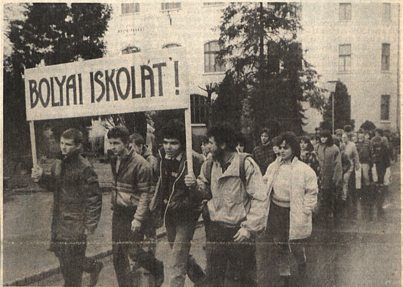
Az egyéni és kollektív jogok kérdése Erdélyben (Cikkünk a 3. oldalon)

(Olcsó oroszok Lengyelországban. Tudósításunk elmélkedése a 7. oldalon)