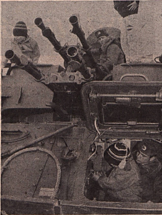
Belülről jó játéknak látszik...

A kapu nemcsak nyitva volt, hanem sarkig tárva, az őrt álló kiskatona már messziről integetett: kanyarodjunk csak be, a tágas laktanyaudvaron lehet parkolni. A gláznoszty, vagyis a nyíltság jegyében immár nem először hirdettek nyílt napot a magyarországi szovjet laktanyákban. Bárki bejöhett, s megcsodál-