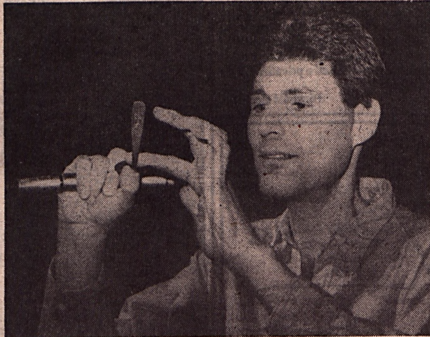
„Kiegyenesíteni már nem tudom...”

Nagyon kell arra vigyáznom, ne hogy félreértsenek az emberek. Jelenleg is egy híres izraeli egyetemen vizsgálnak. Legutóbb ráksejtekre tettem a kezem, azt mondtam: Haljál meg! A sejtek elpusztulnak. A professzorok majdnem meghaltak. Egyébként ez annyira új tulajdonságom, annyira