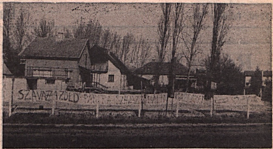
A Balaton-partiak „zöld szíve” Bálint gazdához húz? A „korteshadjárat” apró mozzanata Balatonkenesén.

A magyar állampolgárságot nyert orvosházaspár és gyermekei, mint elmondták, a jövőben is gyakran utaznak majd a szülőföldjükre, Erdély-be. A gyermekek az iskolai szüneteket az író-nagyapánál kívánják eltölteni. (MTI)