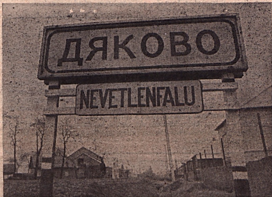
Történt egyszer, hogy a finom grófkisasszonynak nem merték a falujuk nevét megmondani a helybeliek, merthogy az kissé fülsértően hangzott. Egy leleményes atyafi úgy oldotta meg a helyzetet, hogy hazudott, vagy inkább csak füllentett. Fényképes kártyátlajai beszámolónk a 3. oldalon.