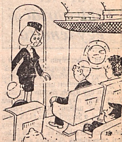
— Tud valaki önök közül Boeingt vezetni?

A Nap kél: 6.42 órakor nyugszik: 17.14 órakor