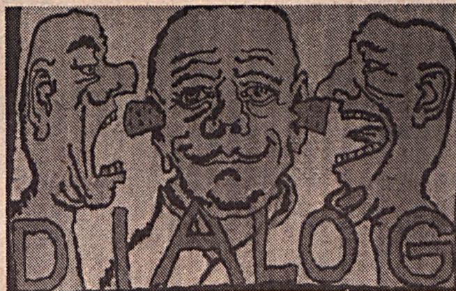
Egy plakát Pozsonyból.