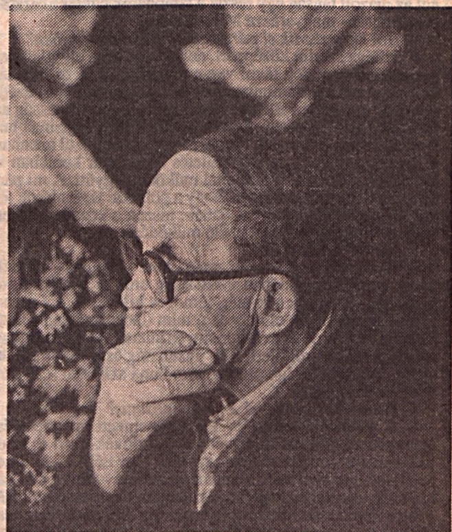
Csak rosszabb ne legyen a sorsunk...