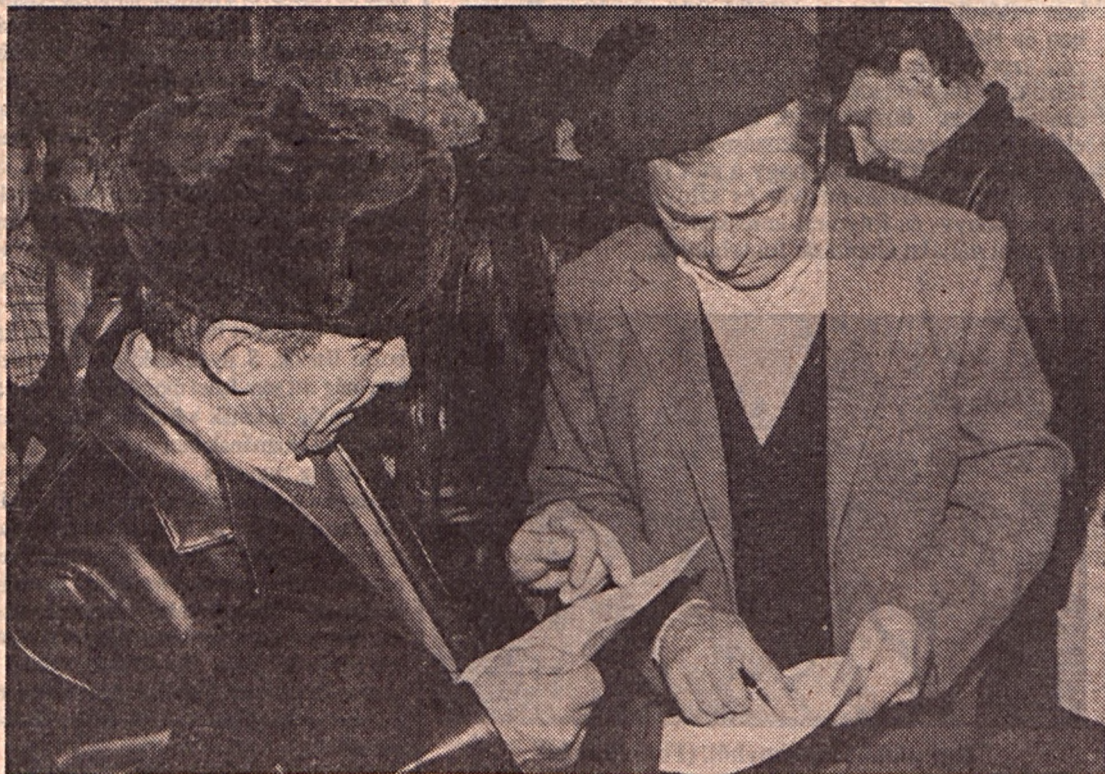
„A plusz egy hónapot megint kifizetik”