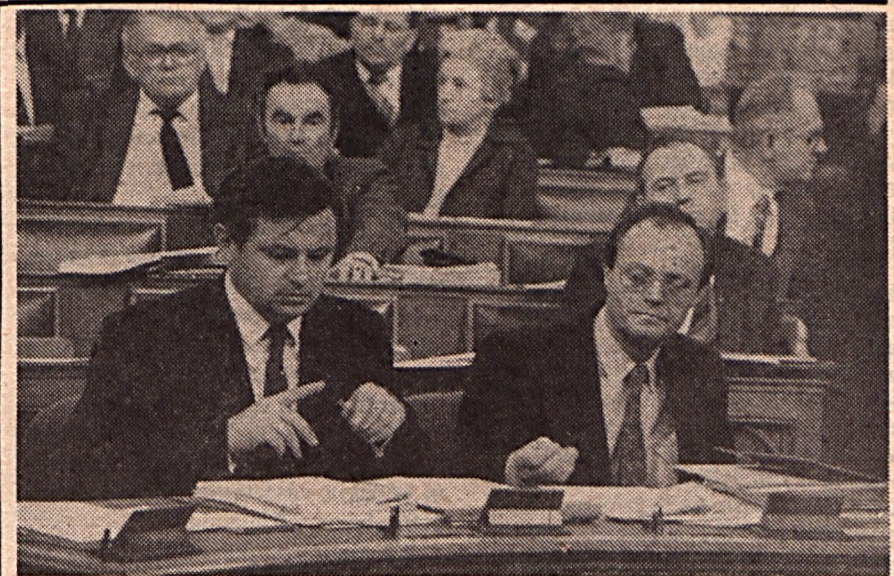
Számoljunk csak! Ide egymilliárd... oda...