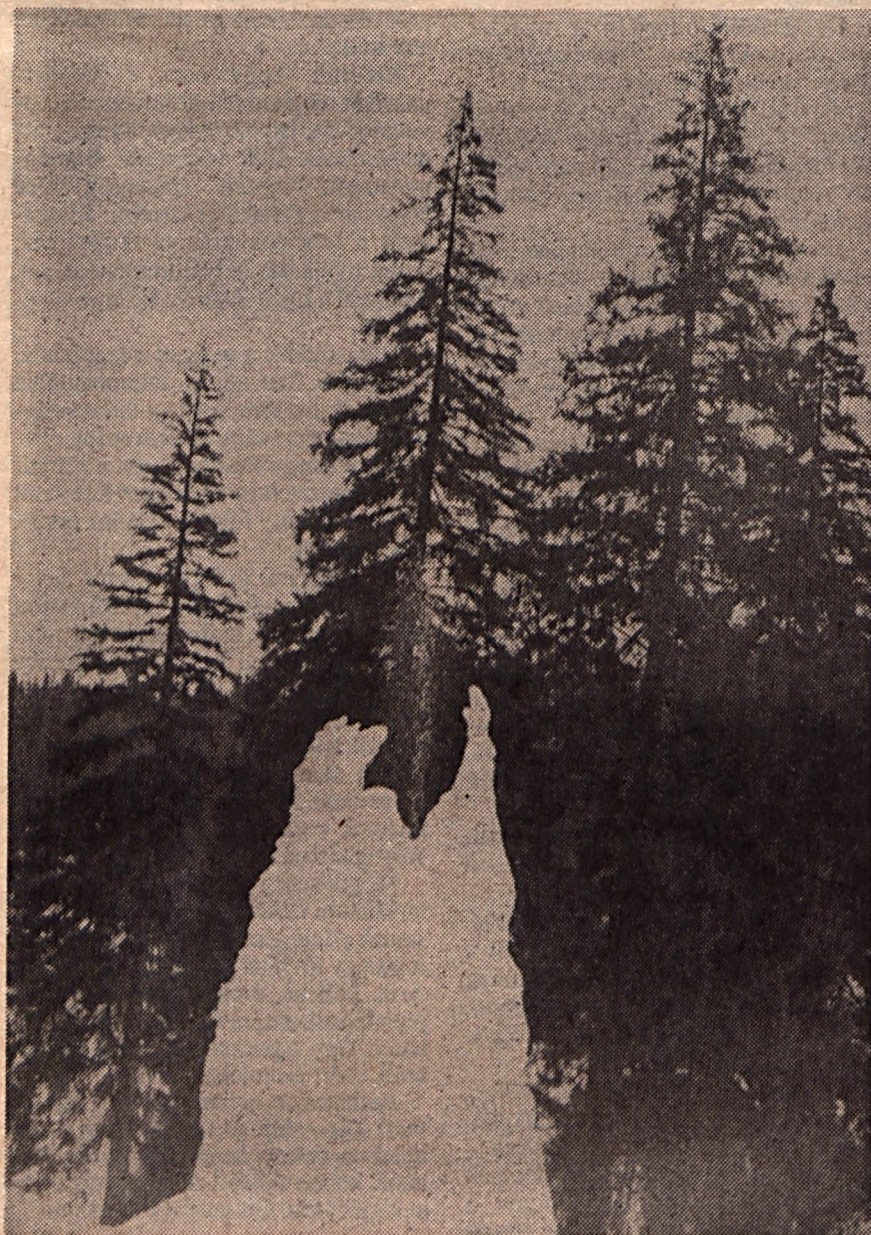
A megfagyott szökőkút (#)