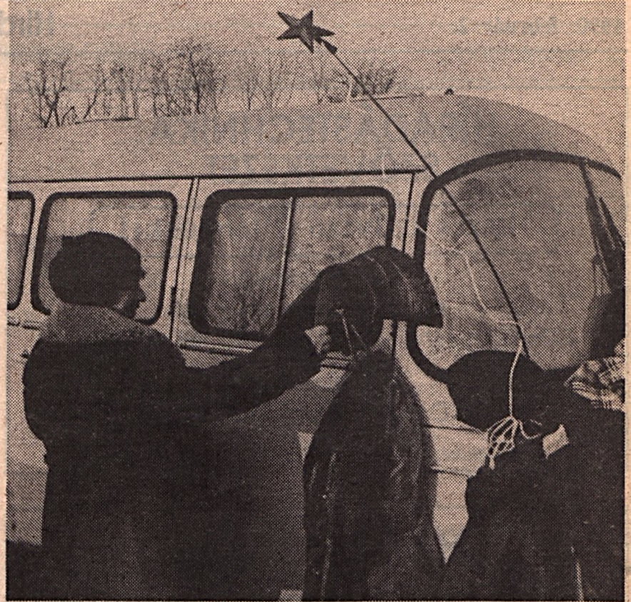
Csillagárusítás a nyíregyházi szovjet–lengyel „KGST”-piacon.

Nekünk, magyaroknak – kár is lenne tagadnunk – hasonlóan fájó pontunk egy másfajta mesterséges megosztottság és elszakítottóság. Akkor is az, ha tudjuk, esztelen és jövőtlen lenne visszakövetelnünk valamiféle egységet, mert sem mód, sem alkalom, de még érv sincs rá. Mert a németek földjén a mindössze néhány tízezres lausitzi szorbokon kívül nincs nemzetiség, Kelet-Közép-Európa pedig olyan tarka, mint valami népi szőtes. Magyar bánat toluljon hát szívéinkbe, ajkunkra? Nem, ne a keserű és hiábavaló ábrándokba meneküljünk, hanem a tevékeny, közös jövőt építő közelségbe. Ha körülötünk mindenki egyaránt megérti, mert meg akarja érteni, hogy csakis együtt lehetünk boldogok, ahogy szomorúak is együtt voltunk, talán még a Dunának, Oltnak is egy lesz a hangja... #