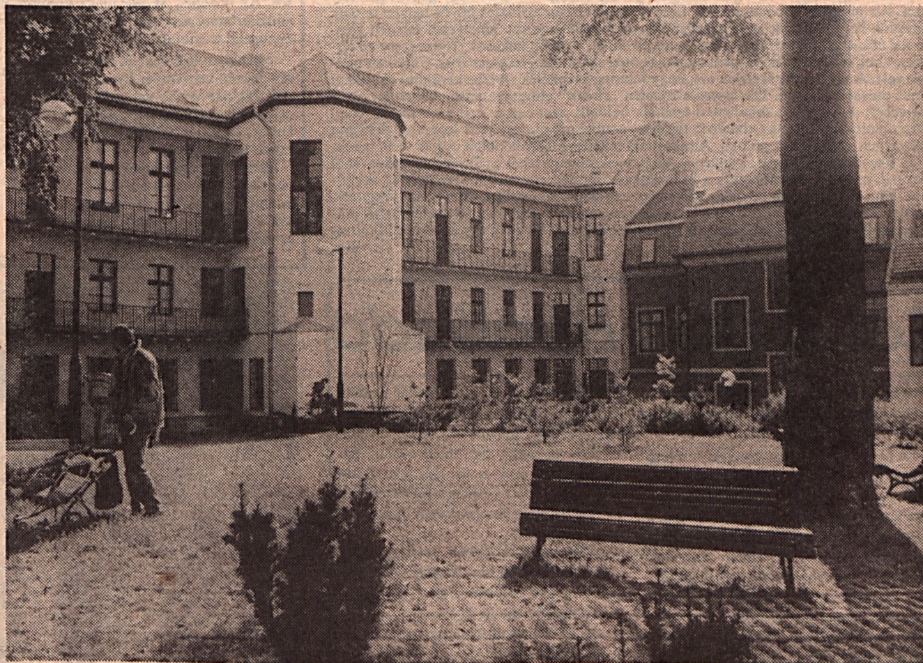
A régi épületek léptékükben, hangulatukban illeszkednek a város hagyományához