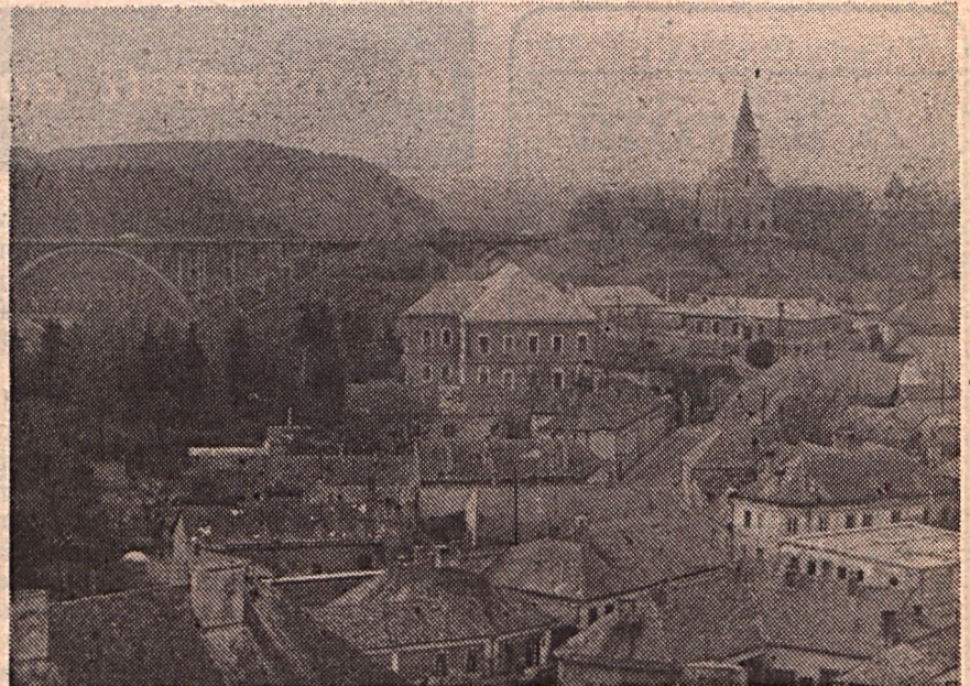
A vár alatti rész a város egyik legszomorúbb látványát nyújtja