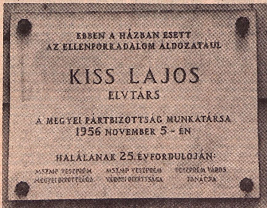
Mint utólag bebizonyosodott, az oroszok lőtték tarkón...

Festői látványt nyújt előttünk az Aranyosvölgy, a Buhim, a Dózsaváros kertés, családi házas környezete. Közélebb menni azonban a legutóbbi időkig kockázatos volt. A valahai paraszti nyegdek a parasztpolgárság