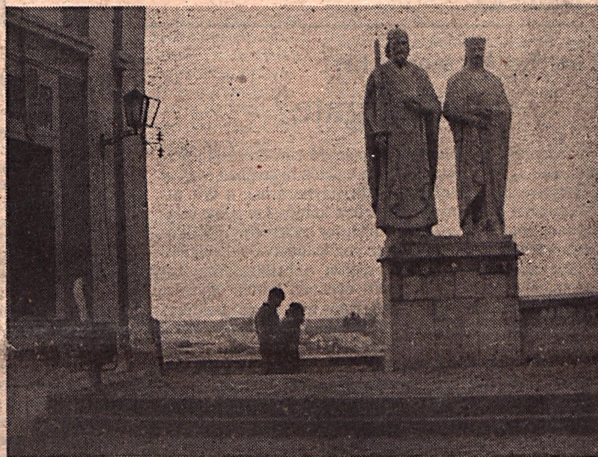
Veszprémi Honkóstolónk a 8-9. oldalon