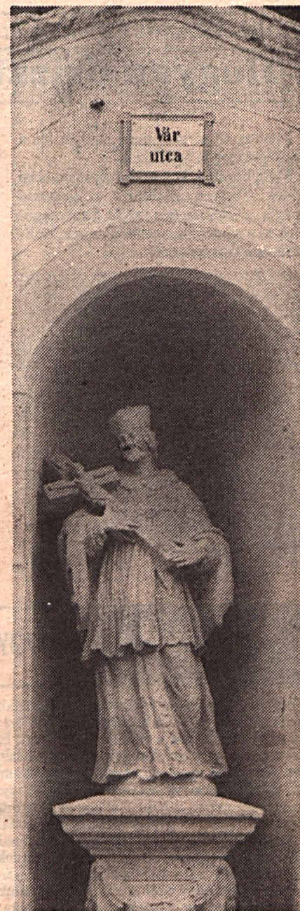
Tolbuhin utca helyett újra Vár utca

Írta: Láng György Géza