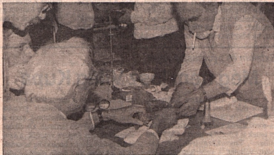
A medence összerakása nélkülözhetetlen a pontos méréshez