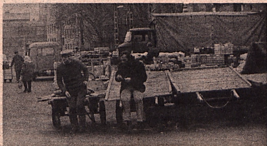
A téli „Bosnyák” lehangoló képet mutat. Szegényes. Riportunk a 9. oldalon.