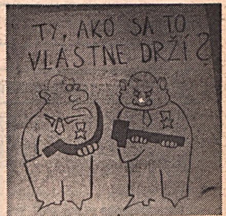
Falragasz Pozsonyban: Mondd, hogy is kell ezt fogni?

Az előzetes közvéleménykutatás alapján összeállított tematika igen változatos. A nyitófoglalkozáson az új alkotmányról hallhattak előadást a résztvevők. A továbbiakban – szintén hétfő esténként – a hazánkban élő nemzetiségek helyzetéről, az önkormányzatok helyéről és szerepéről, a környezetvédelemmel és az egészséges életmóddal kapcsolatos témákról, valamint a vállalkozási lehetőségekről esik szó. A videovetítéssel színesített előadásokat beszélgetések, viták követik.