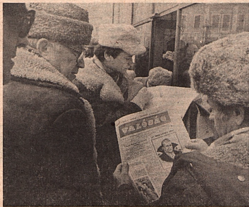
Romániában mindenki újságot olvas... Nagyváradi híradásunk a 8-9. oldalon