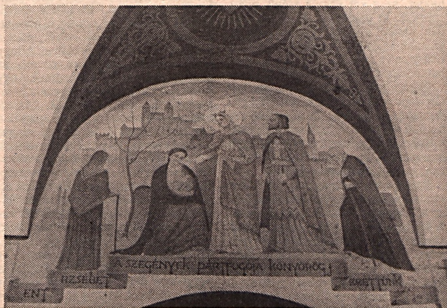
Évtizedek után nyitották meg az egykori kapucinus templomot