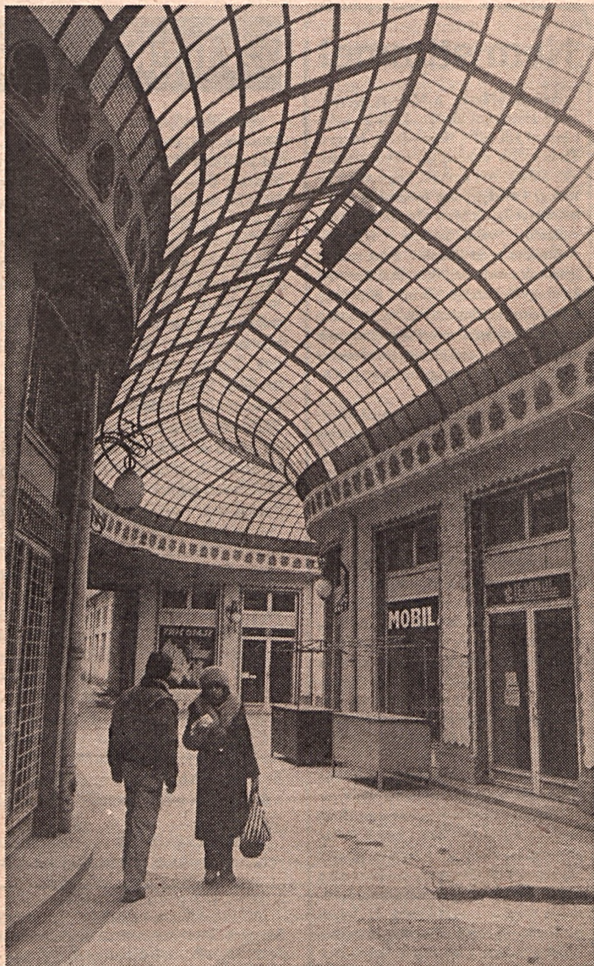
A Sas-palotához hasonlót sem produkált az elmúlt több, mint negyven esztendő

Persze, hetek alatt könyveket írni lehetetlen, az értelmes segéd-eszközökhöz hozzájutni pedig álmom. Hiába tüntették el falakról, könyvek első oldaláról a nemzetrontó mosolygó képét, egy szellemiséget újraéleszteni jóval nehezebb. Elfogódottan hallgatjuk a rémtörténeteket, miként szervezték be a gyermekeket besúgásra, hogyan figyelték társaikat, nevelőiket és jelentették a legapróbb elszólást. Hogyan lehetett így magyar irodalmat, történelmet tanítani?