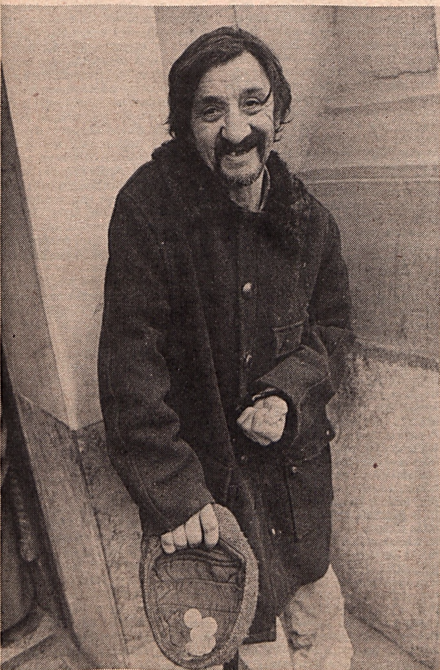
Az ortodox templom bejáratánál

hogy akkor öregasszonyok vették körül és védték meg templomukat. Ottjártunkkor, 1989 utolsó napján zsúfoltságig telt meg Isten valamennyi hajléka. Az ortodox templomban lépni sem lehetett, a napokban megnyitott egykori kapucinus templomban már csak fiatal pár ült csöndben a kora délutánon. Vagy harminc éve nem léphette át senki ezt a küszöböt: a magyar falfeliratok miatt.