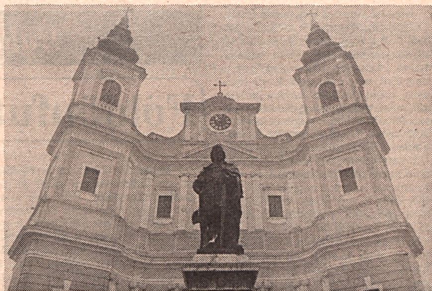
A nagytemplom elé telepített lenyűgöző Szent László-szobor