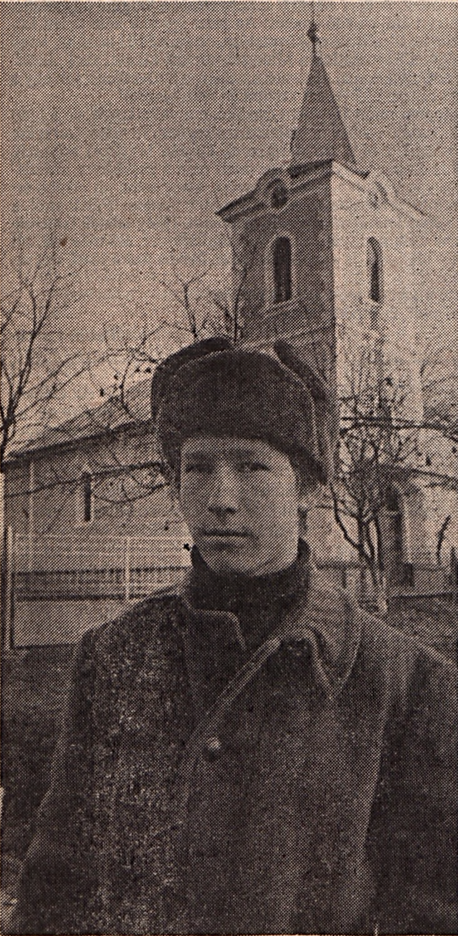
Aki Szilágymenyőre vigyáz...