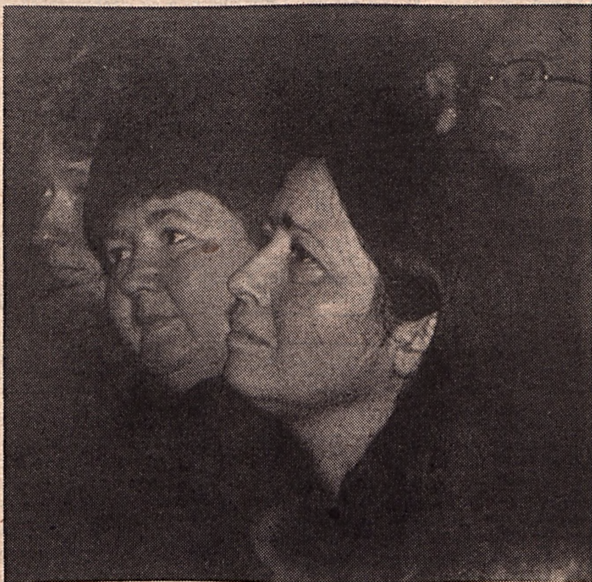
„Szolgásgunk igáját nem vesszük nyakunkba”

– Két oldalról közelítem ezt. Egyfelől vannak tények: a temesvári református templom elől indult a tüntetés-sorozat, ami az egész országra kiter-