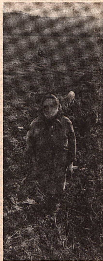
Az elmúlt évtizedek átkos reflexe

– Nem lesz személycsere, csak kiegészülés. Ott van a román értelmiség színe-java, biztató emberek, kezdve Iliescu elnökkel, magányos ellenzékiekkel, színészekkel. Forradalmian és spontánul kerültek a vezetésbe, már