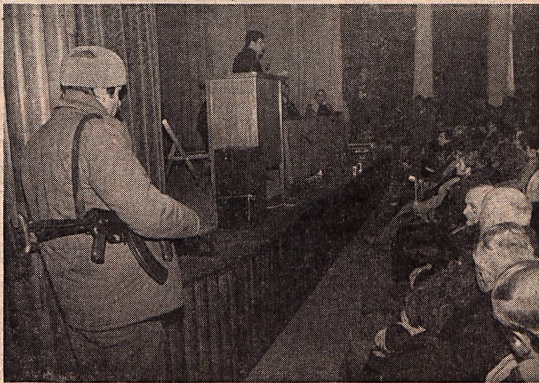
Tőkés László Szilágycsehi polgárai előtt