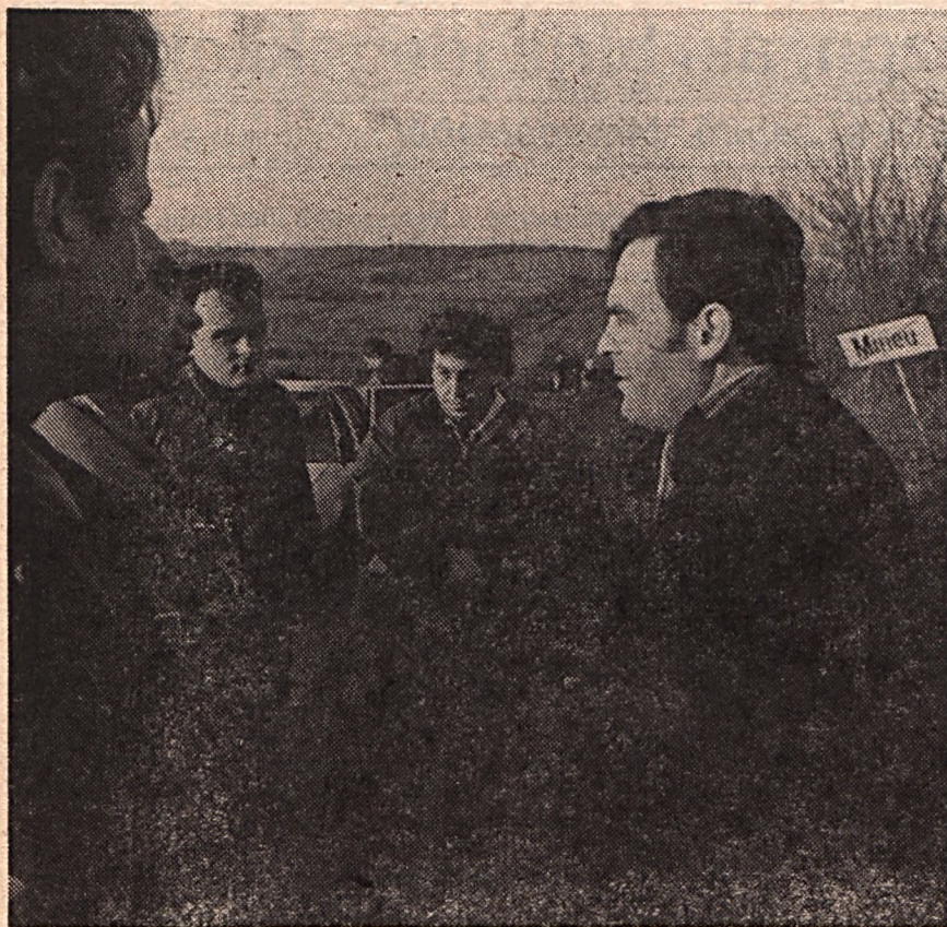
A francia 1-es csatorna stábja Menyő határában