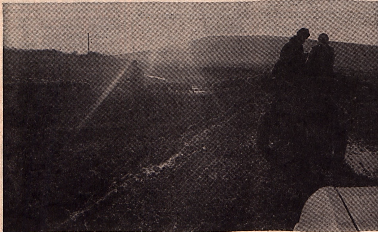
Az út végén Menyő

jedt. Akarva-akaratlanul szerepem volt a forradalmi mozgalom megindulásában. Nem érzem magam hősnek a szó hagyományos értelmében. Ez inkább egyfajta attitűd, Kleist Kolhaas Mihályához hasonlítom, aki megveszekedett küzdött az igazáért. Én olyan magatartást tanúsítottam, az egyházi és állami hatóságokkal, kilenc hónapon keresztül nem hagyva az igazságunkat, ami a maga nemében páratlan volt. Halálos fenyegetésben éltünk, ostrommal foglalták el az egyházat, ez az attitűd olyan értelemben hősies, amennyiben rendhagyó.