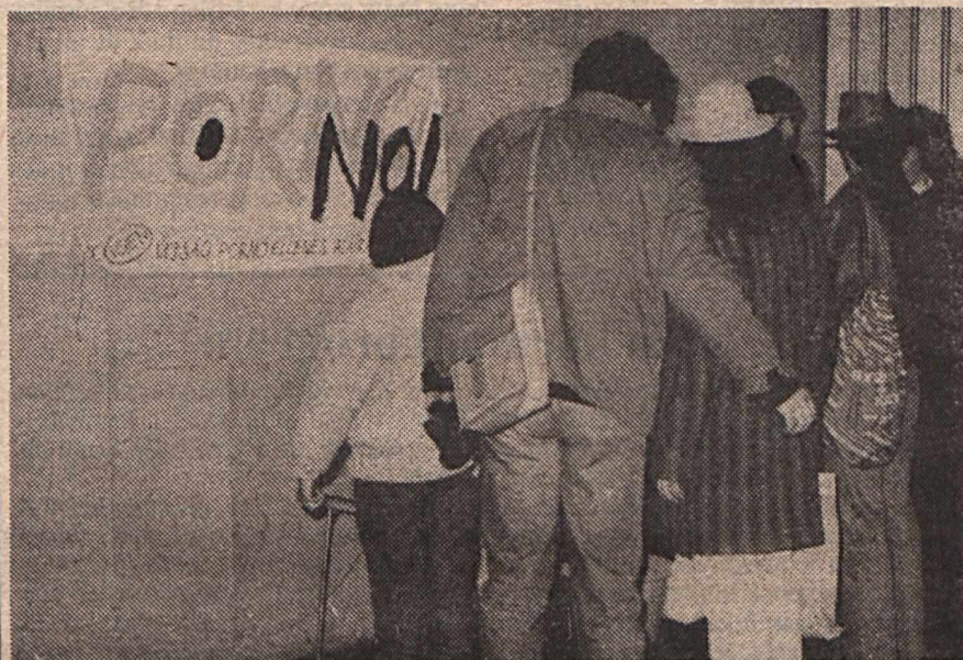
Harc a pornográfia ellen. Írásunk a 7. oldalon.