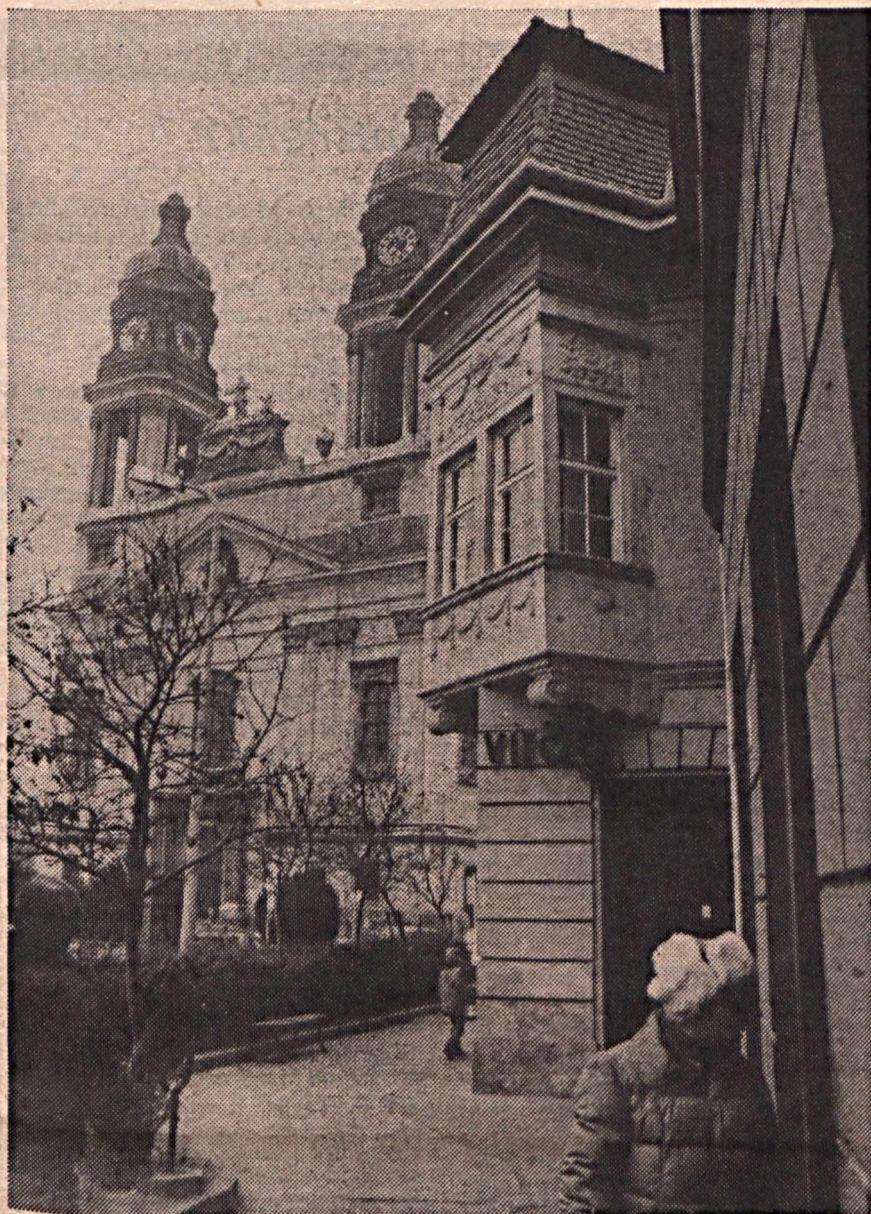
A copf stílusú pápai főtér