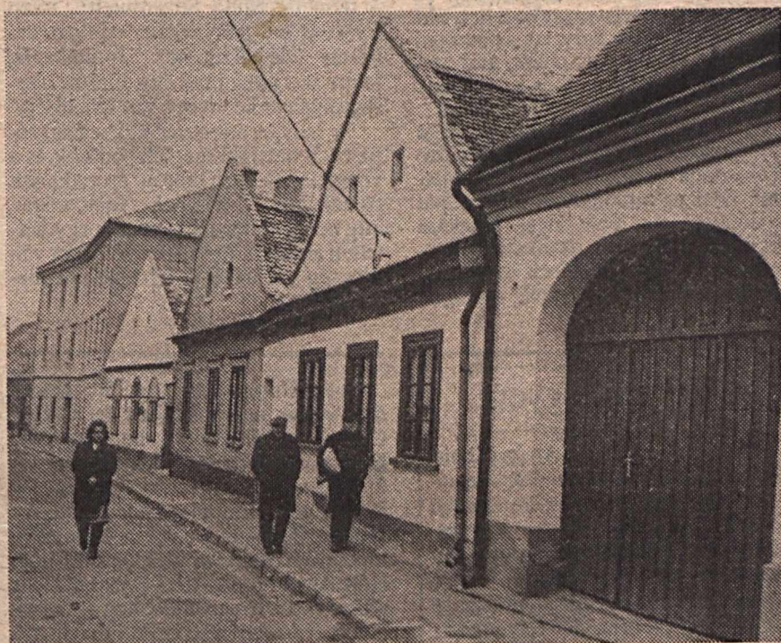
A régi épületek öröme, gondja Pápán (9. oldal)