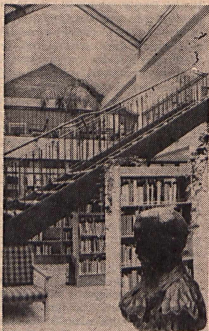
Végre méltó helyen a 95 ezer kötetes városi könyvtár

Takács Zsuzsanna Kapfinger András felvételei