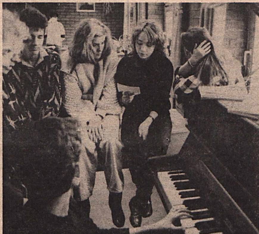
Balassagyarmati fényképes riportunk a 4. oldalon található