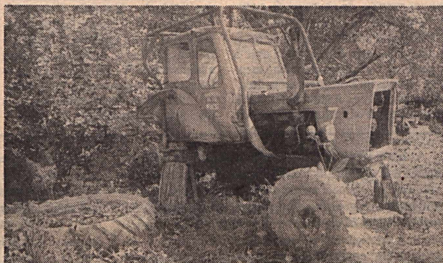
A Baranya Megyei Termelőszövetkezetek Szövetségének elnöksége ülést tartott Pécsen, melynek legfontosabb napirendje: a tsz-kongresszus előkészítése volt.

(emlékezés egy emlékoszlop alatt 9. oldal)