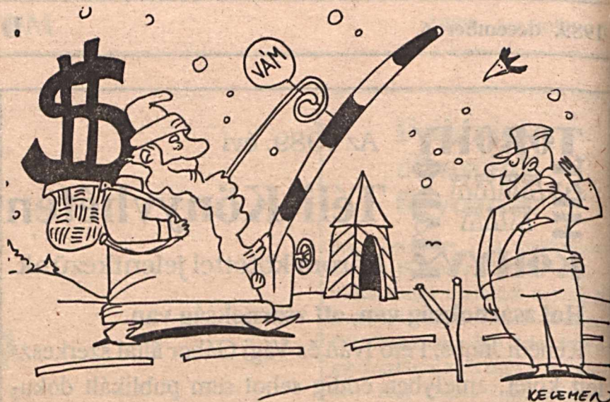
Ülést tartott a Hiltonban a Vámegyütműködési Tanács