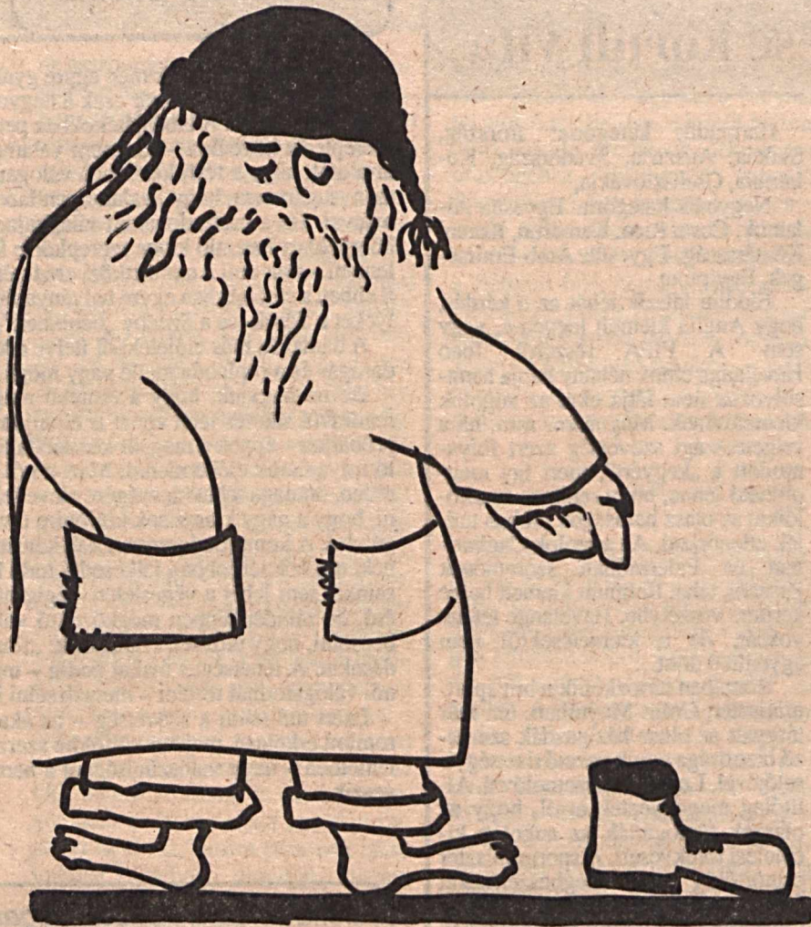
A cipőjéből kilábolt Mikulás dala

Mezitlábolok – s nem álságból: Kilábolnék a válságból! De nem tudok, csak a cipőmből.