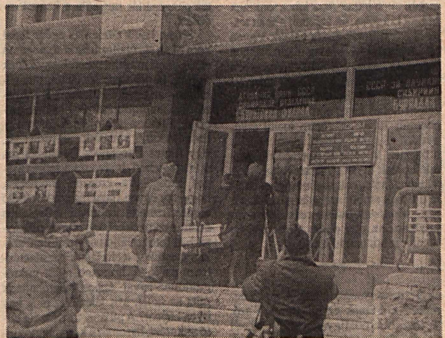
Petőfi csontjai egyelőre beköltöztek a Burját Akadémia épületébe