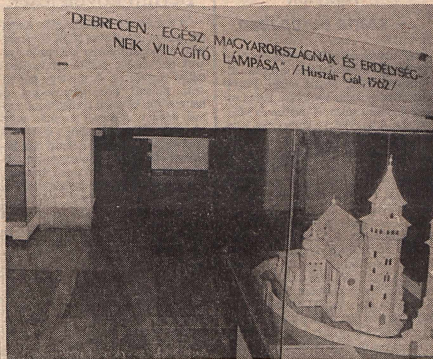
Honkóstolónk ezúttal a kálvinista Rómát, Debrecent mutatja be a 8-9. oldalon.