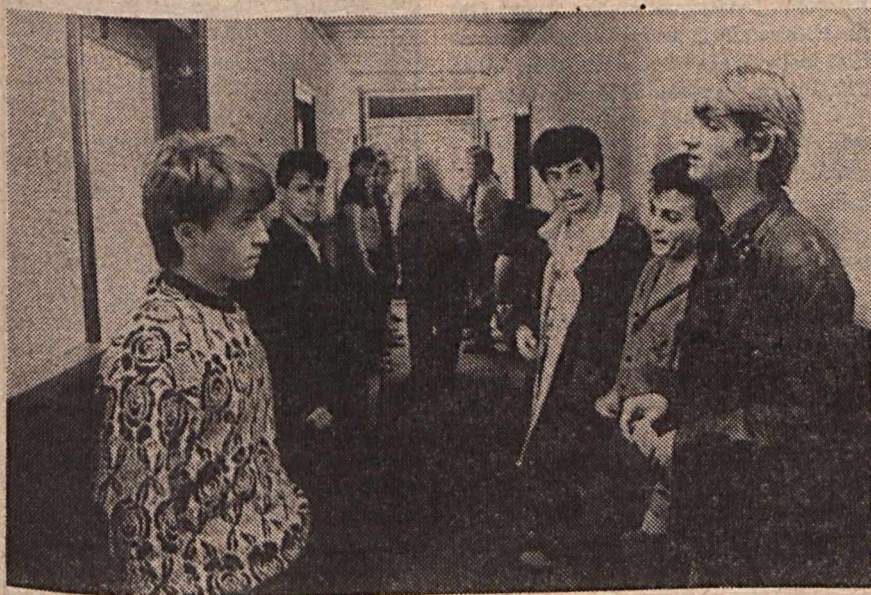
A befogadóállomáson első fokú menekültügyi hatóság működik Békéscsabán. Írásunk a 8–9. oldalon.