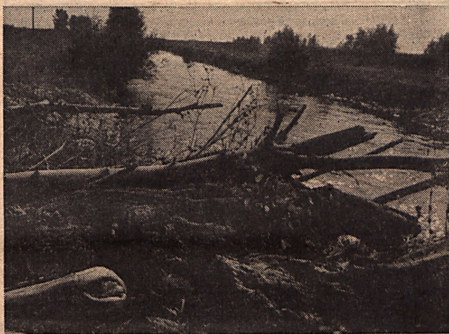
Budapesten tegnap a vízvédelemről rendeztek tudományos napot, Nagykánizsán pedig nyugat-dunántúli környezetvédelmi konferenciát tartottak.

(Vélemény a világkiállításról az 5. oldalon)