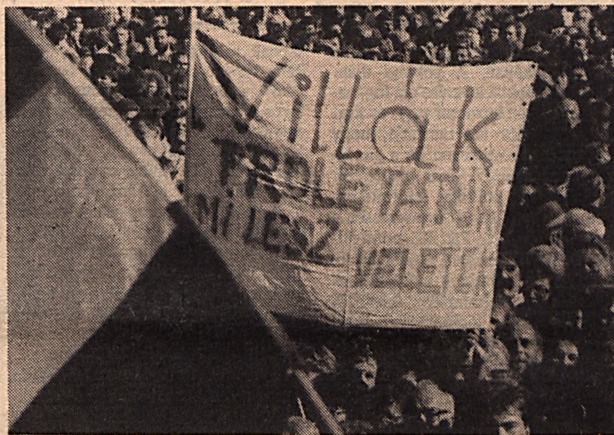
A köztársaság első napján