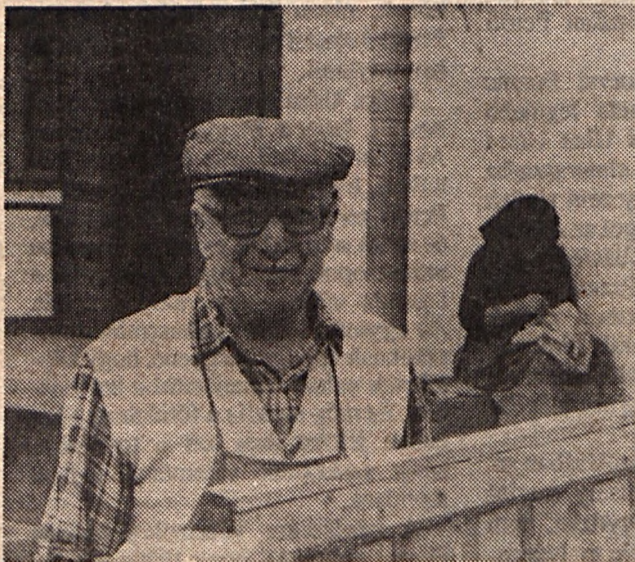
Megállt az idő...