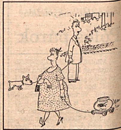
Egy kis séta...

— Párizsban vasárnap 54 éves korában elhunyt a hazánkban is jól ismert jugoszláv író, Danilo Kis. Halálát rák okozta. Az író évek óta a francia fővárosban élt. A szabaddal születésű, magyarul jól tudó író pályafutását fordítóként kezdte és több magyar művet, köztük Petőfi verseket is lefordított szerb nyelvre. Élénk kapcsolatokat tartott fenn magyar írókkal, több ízben is állást foglalt az irodalom szabadsága mellett. A jugoszláviai politikai eseményekkel kapcsolatban is a változások aktív hívének tartották. Művei hazáján kívül számos országban jelentek meg.