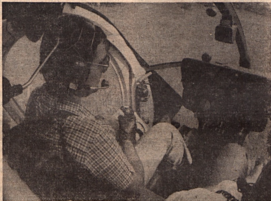
Indul a szitakötő... (Cikkünk az Aerocarításról az 5. oldalon)