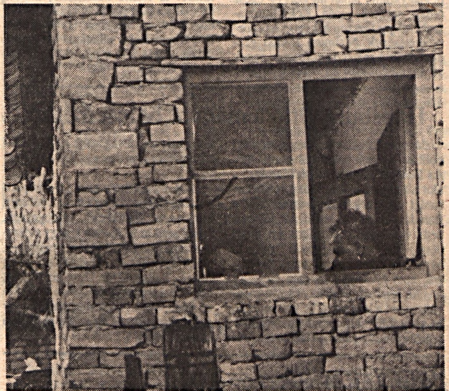
Szeretnénk, ha hálózatunk vidéken is megerősödne. Mi nem kérünk a szegénység-ről bizonyítványt. Írásunk a SZETA-ról az 5. oldalon.