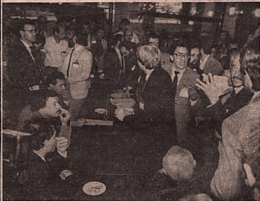
Vita a reformszövetségen belül