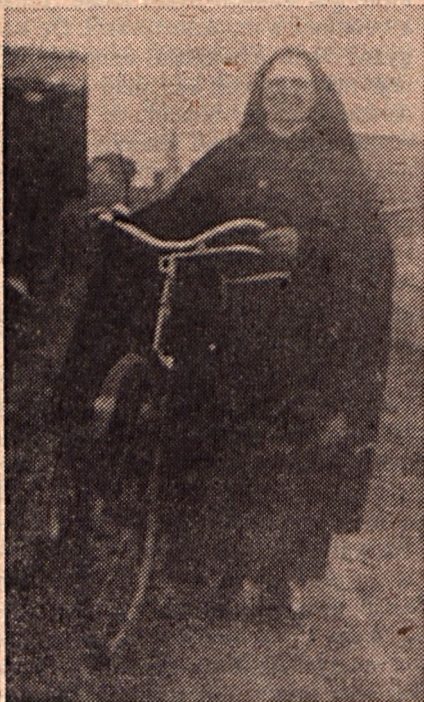
Útban a tanyákhoz

— Szeptember elején egy 10 napos lelkigyakorlat után vettem fel újra a szent ruhát és megfogadtam: Soha többé le nem veszem! Ez még ugyanaz a ruha — egy nylonzacskóban sikerült